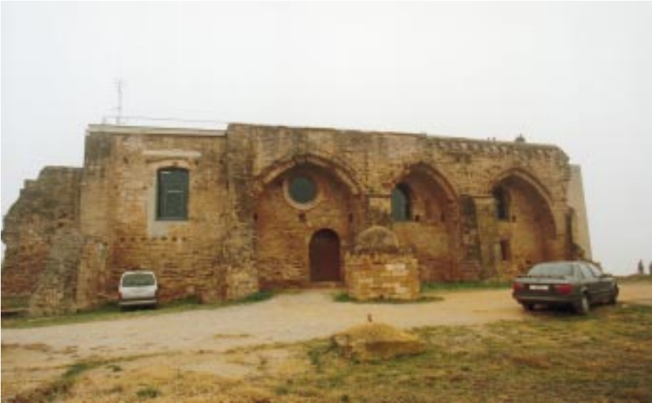
A la pàgina de l'esquerra i a sota: dues recreacions virtuals de l'exterior i l'interior del complex museístic. Al costat, una imatge del castell de la Suda, que acollirà un mirador panoràmic sobre la ciutat.

oferirà un recorregut cronològic amb nou apartats que aniran dels ilergetes al municipi actual, i albergarà una maqueta de Lleida situada en un espai-mirador sobre la població. El visitant, a més, tindrà una visió viva de la ciutat gràcies a les imatges en directe enviades per diverses càmeres de vídeo instal·lades a punts estratègics de Lleida.