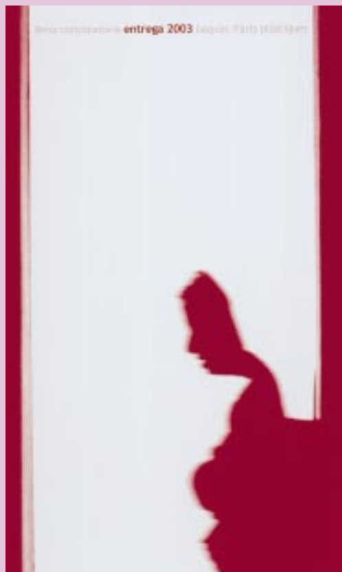
Imatge del fullet que promociona la nova edició d'Entrega 2003, beques d'Arts Plàstiques.

Un jurat decidirà la concessió de les tres beques i l'Ajuntament farà efectiva la quantitat de l'ajut anticipadament