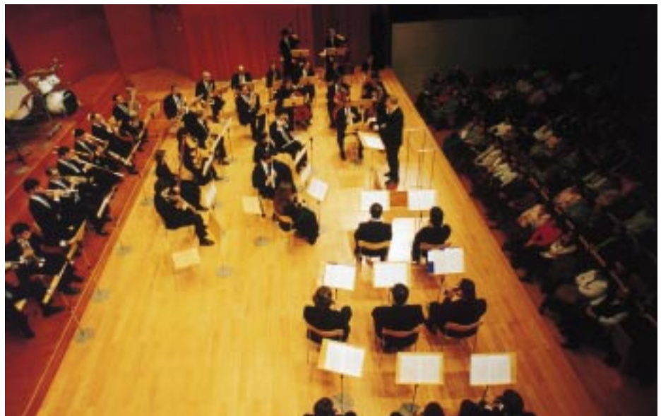
La música, un dels ingredients principals de l'oferta cultural d'aquests mesos.

A l'Espai 3 (antic convent de Santa Teresa) es podrà veure teatre infantil, amb les companyies Xumet i Xinxeta, Teatre Nu, Teatre del Temps i El Sidral. També, fins al 9 de març, al Centre Cultural de la Fundació "la Caixa" es desenvolupa el 7è Cicle de Titelles, amb companyies com Marduix, Centre de Titelles de Lleida,