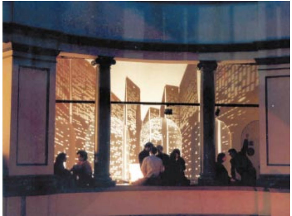
Un espectacular muntatge de la companyia La Cònica/Lacònica.

La dotació del premi és de 12.000 euros, que s'han d'invertir en la producció de l'espectacle del qual s'ha presentat el projecte. A més, els ajuntaments adherits a Transversal-Xarxa d'Activitats Culturals