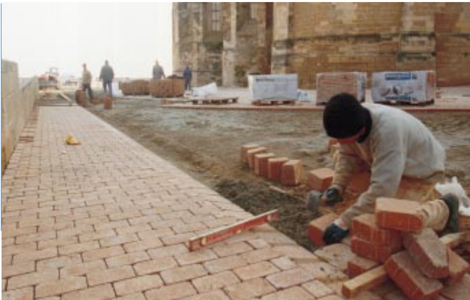
La Paeria aprofita la pavimentació de l'entorn de la Seu Vella per renovar les xarxes de serveis.

Les obres d'urbanització que la Paeria està fent a l'entorn de la Seu Vella avancen a bon ritme. Els treballs inclouen la pavimentació de la plataforma de la Seu Vella, la consolidació de les muralles del baluard de la Reina i de la capçalera de la catedral, i la construcció d'un mur de contenció a la rampa que accedeix a la plaça dels Apòstols i a la Suda. L'obra es completa amb la instal·lació dels serveis d'aigua, electricitat, gas i sanejament.