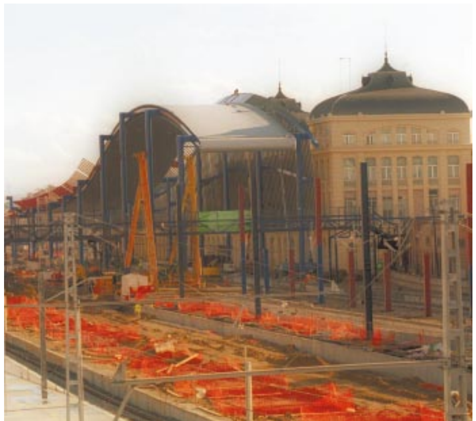
A dalt, esbós del futur Parc dels Magraners i a baix, les obres que s'efectuen a l'estació.

ha previst un nou edifici ferroviari d'entrada des de Pardinyes, un nou pont sobre el riu, que anirà de l'estació a la plaça de la Sagrada Família (darrera dels Camps Elisis), i el cobriment del ferrocarril, des del carrer de les Corts Catalanes fins al carrer dels Comtes d'Urgell, obra que implica la perllongació de l'avinguda de Prat de la Riba.