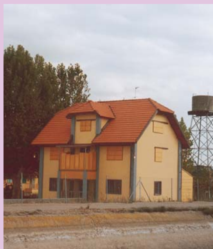
El recuperat xalet de La Canadencia.

La fundació permetrà la integració dels sectors privat i públic, ja que aquest tipus d'ens afavoreix la implicació per part de les empreses, que legalment