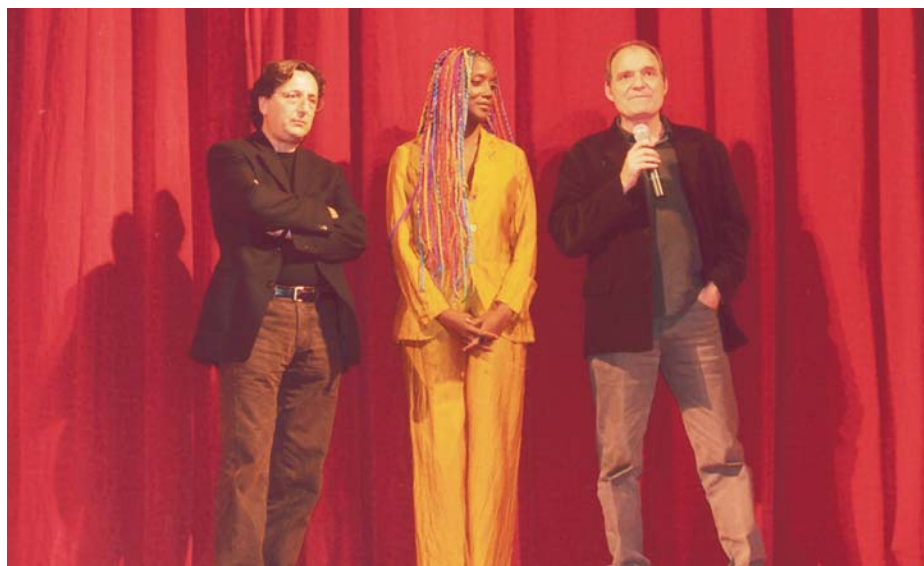
Una imatge retrospectiva de l'edició de l'any passat del festival.

Les cintes programades són Madregilda , de Francisco Regueiro; Tierra y libertad , de Ken Loach; Lugares comunes , d'Adolfo Aristarain; Cosas que dejé en La Habana , de Manuel Gutiérrez Aragón; Guantanamo , de Tomás Gutiérrez Alea, i El último tren , de Diego Arsuaga.