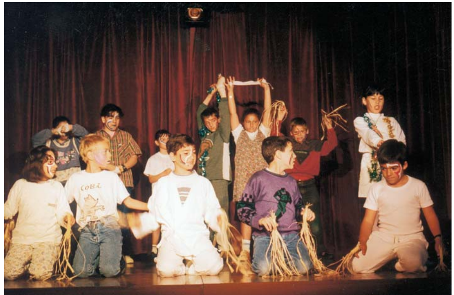
La Paeria porta a terme des de fa anys iniciatives de pedagogia teatral adreçades als infants.

Els nens i nenes de quart i cinquè de Primària han representat una quinzena d'obres teatrals de caire molt divers, entre les quals apareixien títols com Oliver Twist , Història d'un cavall , El País de mai més o Companys de classe . Els tallers han estat impartits per