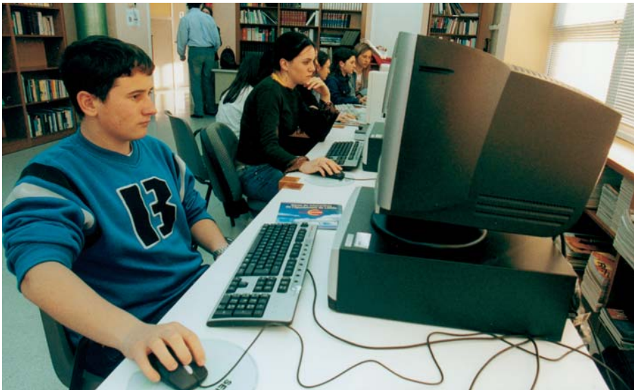
Els telecentres de Raimat –a la fotografia– i Sucs tindran una connexió especial via ràdio.

culturals, geogràfiques, econòmiques–, la gent no té les mateixes opcions d'accedir a les eines telemàtiques que la resta de la població.