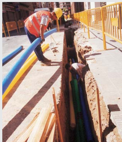
Obres de col·locació del cable a Lleida.

La Paeria subministrarà les dades a l'equip de treball de la UdL, que és el que farà l'estudi pròpiament dit. S'analitzarà el procés d'implantació de les NTIC en els darrers cinc anys i el ritme d'incorporació