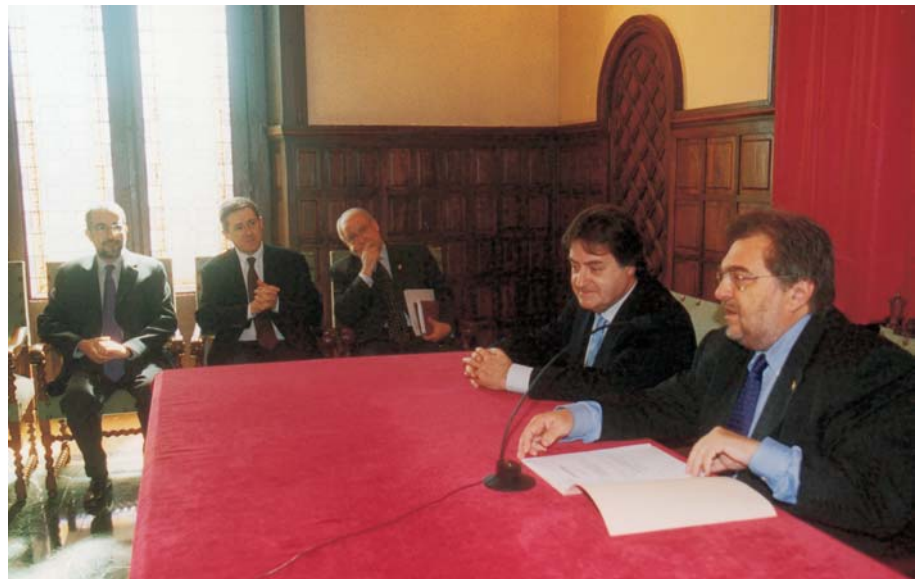
La signatura del conveni va tenir lloc el 4 d'abril al Palau de la Paeria.

L'Ajuntament de Lleida s'ha adherit aquest mes d'abril a l'Agència de Qualitat d'Internet (IQUA) amb la finalitat de contribuir a establir unes normes d'autoregulació en els usos i els continguts d'Internet que millorin la seva funció social. Antoni Siurana, alcalde de Lleida, i el president de l'IQUA, Francesc Codina, van formalitzar la signatura del conveni el 4 d'abril al Palau de la Paeria.