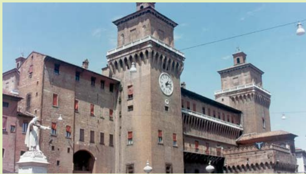
Lleida col·labora en aquest programa amb ciutats com Ferrara.

La nostra ciutat participa en un projecte de cooperació urbanística amb l'objectiu de fomentar l'intercanvi d'experiències i coneixements urbanístics entre Europa i Amèrica Llatina. El projecte deriva del programa europeu URB-AL i assigna un tema de treball a cada ajuntament que hi participa. Lleida ha acollit l'1 d'abril una primera reunió de treball sobre els "Instruments de redistribució de la renda urbana", que és el tema assumit per la Paeria.