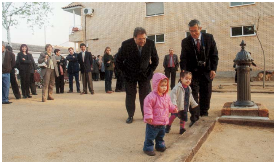
El nou espai de 400 metres quadrats s'ha pensat especialment per als més petits del barri.

El Centre Especial de Treball ha executat l'adequació de l'espai, dissenyat seguint l'exemple d'altres places que han donat bon resultat. Així, el paviment del recinte és de sauló –un terreny de consistència tova– combinat amb travesses fèrries que fan d'element de separació.