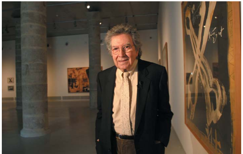
La inauguració va comptar amb la presència del mateix Tàpies.