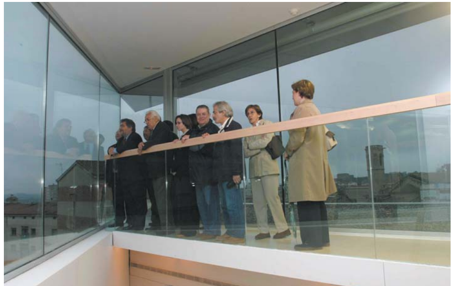
Una de les característiques destacades de l'edifici és la seva adaptació al Centre Històric.

El nou equipament, destinat a usos lúdics i ciutadans, és situat a la plaça de l'Ereta i ocupa una superfície de 1.652 m 2 útils.