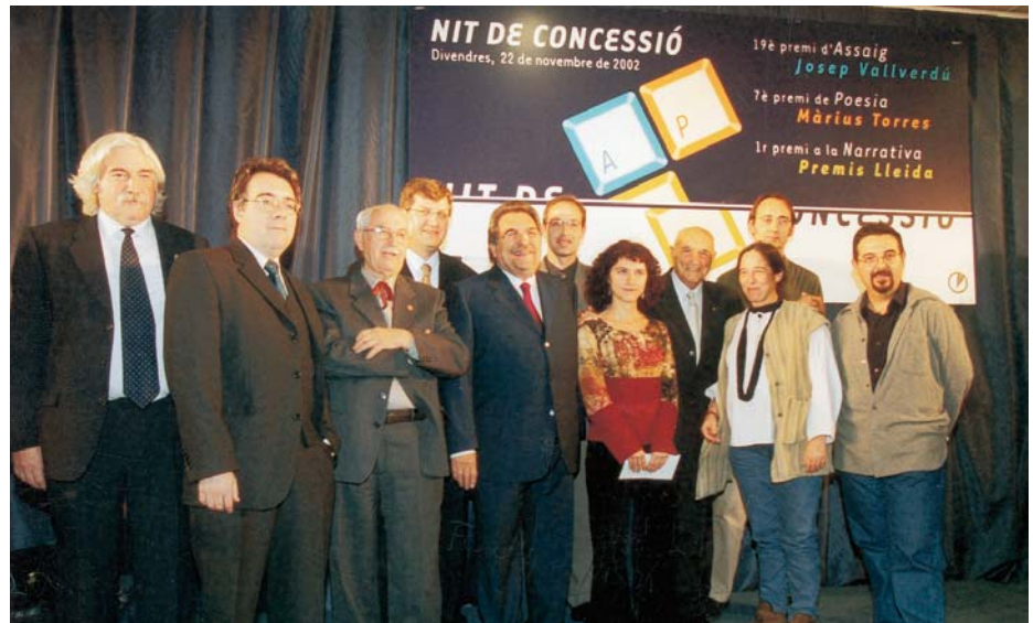
Imatge retrospectiva de l'edició de l'any passat del lliurament dels guardons.

En l'apartat dedicat a la poesia, les dues institucions han convocat el 8è Premi Màrius Torres, dotat en aquest cas amb 4.508 euros per a l'obra guanyadora i 1.505 euros per a la finalista. En aquest