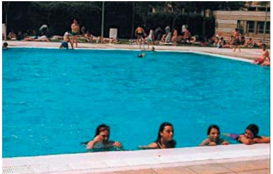
Les piscines del barri de La Bordeta.

Les instal·lacions de Pardinyes són les que més banyistes han registrat, amb una tercera part del total d'usuaris, 40.349. La llista continua amb les piscines de les Basses d'Alpicat i de la Bordeta, que també apleguen