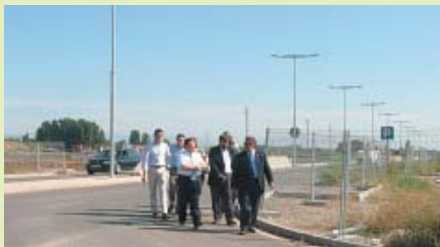
L'alcalde de Lleida va visitar les obres el 18 d'agost.

Pardinyes és un dels barris que més està creixent urbanísticament. En la seva fase d'expansió són previstos una gran àrea residencial de 597 habitatges i un ampli espai d'uns 16.000 m 2 per a equipament públic. La zona per urbanitzar, denominada SUR 13, es troba al vèrtex dels barris nord de la ciutat, delimitada pel sud amb la rambla que unirà Pardinyes amb Balàfia i dividida en dos per la connexió amb la carretera Lleida-Balaguer.