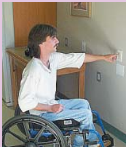
Un habitatge adaptat.

Amb la mateixa finalitat d'adequar els pisos a persones amb discapacitat, l'Associació de Promotors i Constructores s'ha compromès a fer sense cap cost les obres necessàries a les empreses que s'adhereixin a l'acord signat.