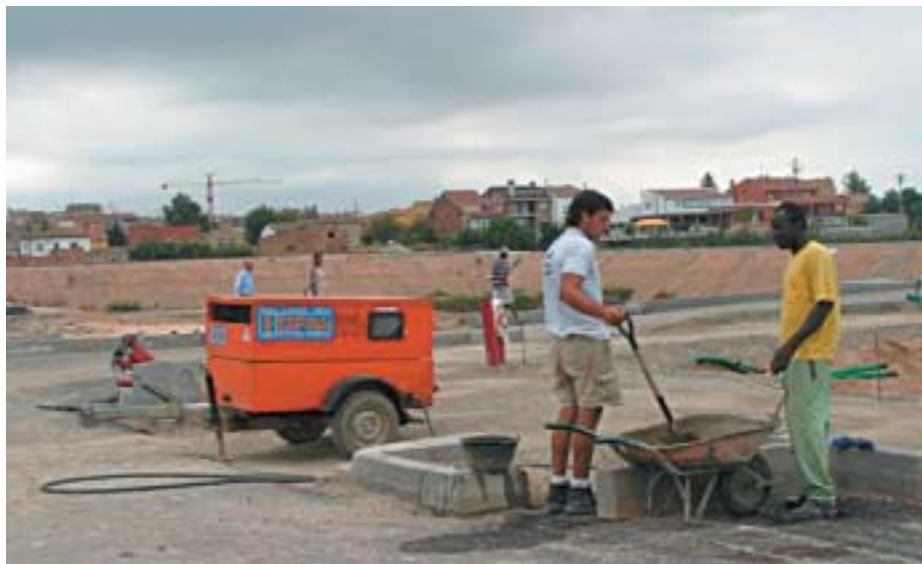
La zona albergarà un parc urbà de 8 hectàrees.

El Pla General de la ciutat estableix dins