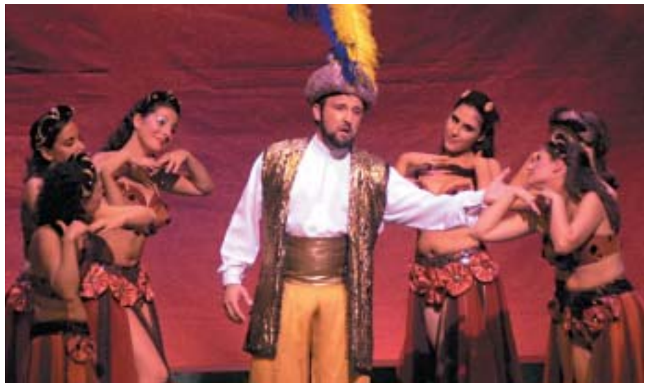
Lleida acollirà aquesta atractiva programació d'òpera.

D'aquesta manera, el Faust de Goethe que es podrà veure a la ciutat de Lleida correspon a l'espectacle que es va estrenar fa més de 100 anys a la ciutat de París amb l'acompanyament d'un ballet, que en aquest cas l'interpretarà la Companyia de Ballet David Campos.