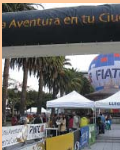
Imatge del concurs celebrat a La Coruña.

L'activitat pretén aplicar coneixements sobre l'orientació als nuclis urbans. Amb aquest plantejament, els participants de la prova rebran una brúixola i un mapa sense el nom dels carrers i amb sis punts indicats (places, monuments, carrers, etc.) que s'hauran de localitzar.