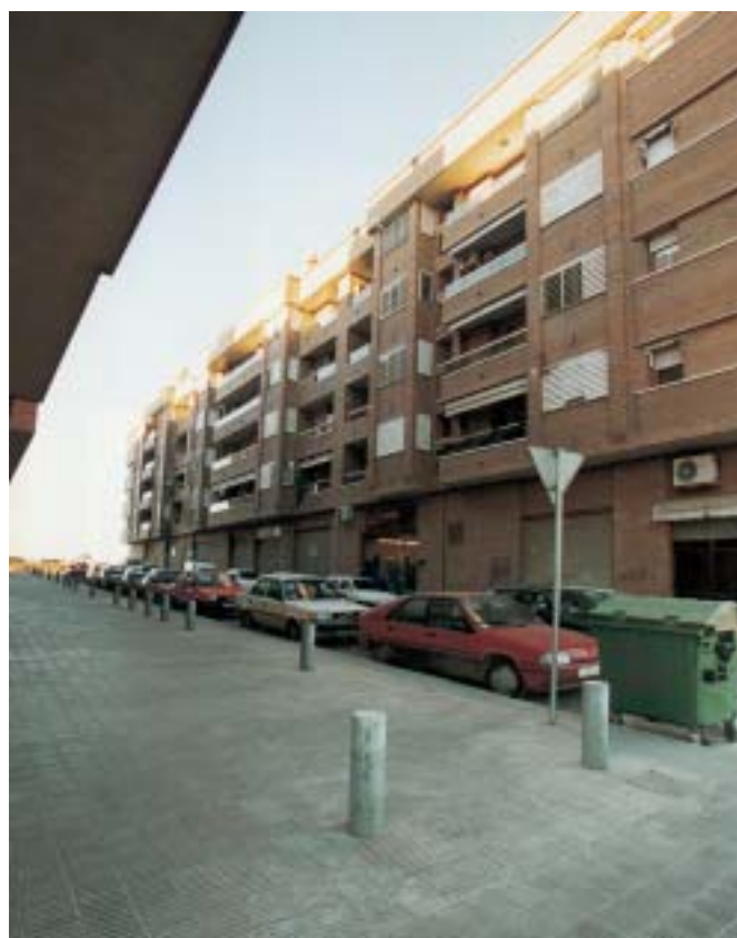
Es bonifica l'IBI de la primera vivenda per a famílies nombroses.

Com a conseqüència de la Llei de Residus aprovada pel Parlament de Catalunya, l'ordenança de la taxa de recollida d'escombraries registra canvis importants. La nova Llei estableix que els ajuntaments com el de Lleida han de pagar a la Generalitat un cànon d'abocament de 10 euros per tona