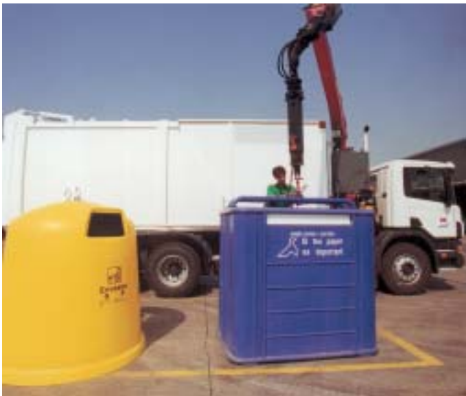
L'ordenança de la taxa d'escombraries registra canvis importants.

Les taxes socials s'actualitzen per sota del 4,55% general