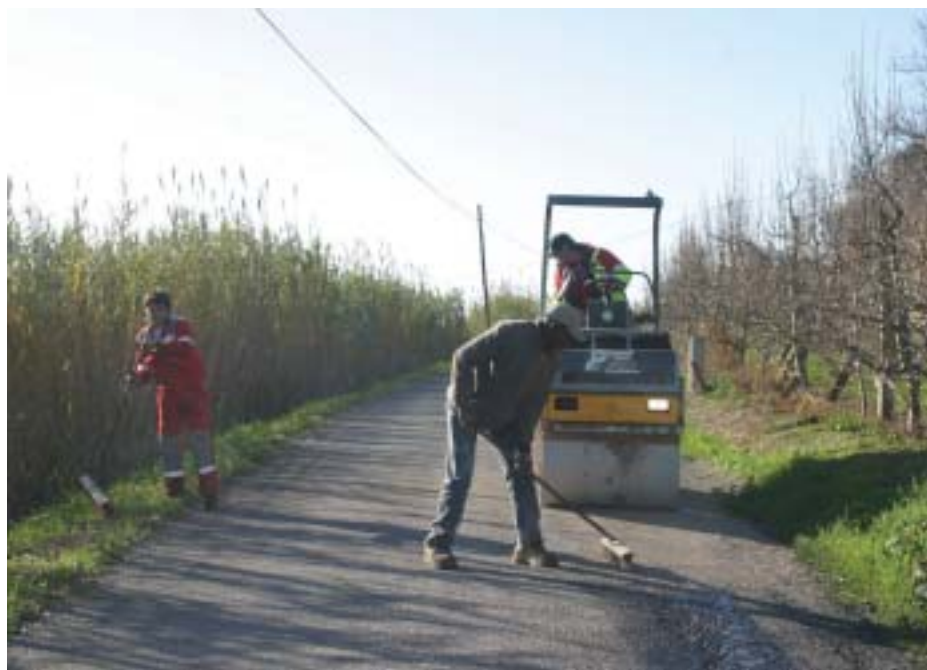
Feines d'agençament fetes aquesta tardor en un camí rural de Lleida.

Seguint el mateix plantejament, i a instàncies de l'Ajuntament de Lleida, l'Ens Gestor d'Infraestructures Ferroviàries (GIF) també participarà en la millora d'aquells camins rurals de Lleida que s'hagin vist