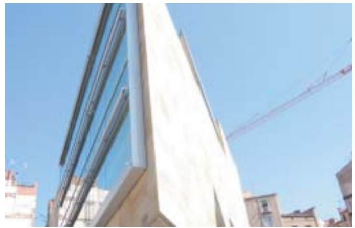
El Centre Històric rebrà enguany una inversió important.