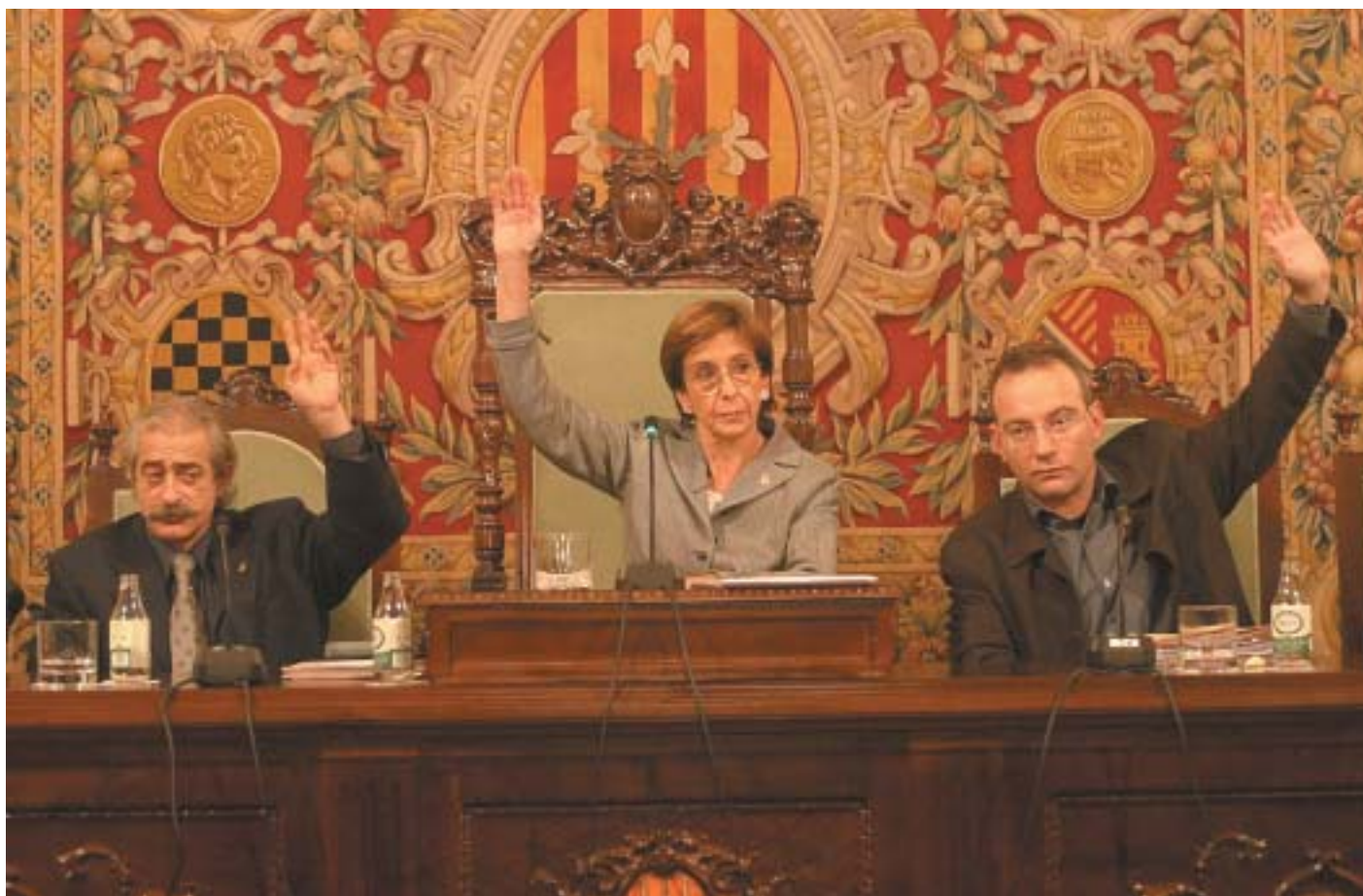
Els comptes municipals van ser aprovats en el ple extraordinari del passat 30 de desembre amb el vot favorable del PSC, ERC-EV i ICV.

La Paeria aprova un pressupost basat en criteris de rigorositat i en la prioritització dels àmbits social, cultural i de la sostenibilitat