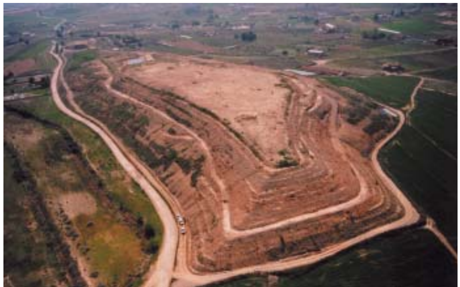
La imatge superior mostra l'estat actual de l'antic abocador de Serrallarga. A la imatge inferior es pot veure una recreació del futur parc de lleure.