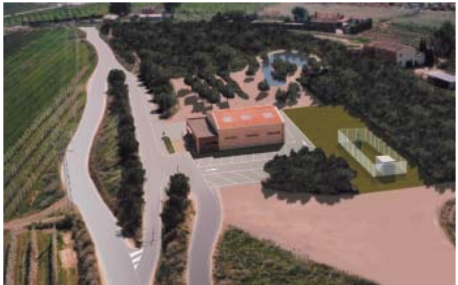
Es construirà una aula ambiental aprofitant les antigues instal·lacions existents.

Aquesta inversió comporta la recuperació d'una zona fora d'ús que possibilitarà un nou espai de lleure per al gaudi dels lleidatans i lleidatanes.