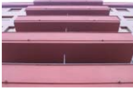
L'oficina promourà 300 pisos de lloguer.

L'Ajuntament de Lleida ha acordat crear una Oficina Local d'Habitatge, que estarà coordinada per l'Empresa Municipal d'Urbanisme i tindrà com a primer objectiu fixar el mapa de solars on es construiran pisos de lloguer i pisos de protecció oficial.