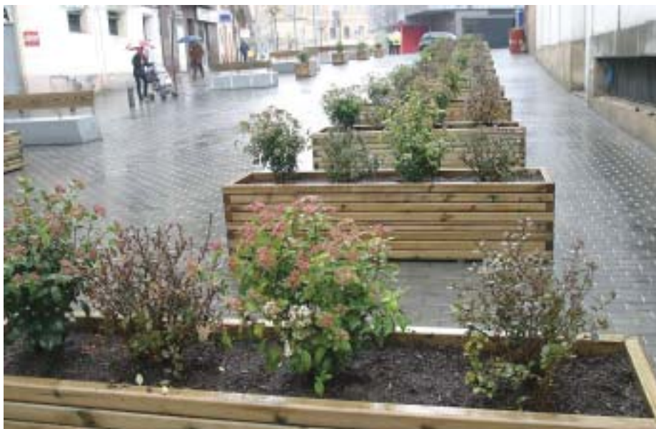
L'obra permet reordenar i millorar el trànsit del Centre Històric.

En total, l'àmbit de l'actuació correspon a una superfície de 4.084 m 2 . El pressupost dels treballs ha estat de 541.908 euros.