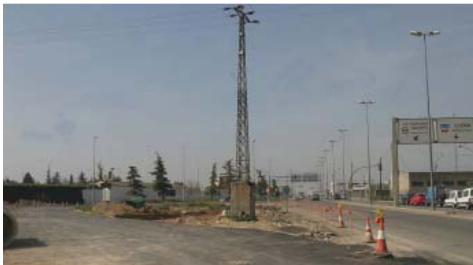
La Paeria recomana que els conductors evitin la circulació en el tram afectat per les obres.

Les obres de construcció d'una nova rotonda per part del Ministeri de Foment a la carretera Nacional II, a l'altura del cementiri, impliquen limitacions importants del trànsit en aquesta zona, que es perllongaran durant un període màxim de 3 mesos. Amb motiu de les obres, hi haurà una desviació provisional a través d'un carril per cada sentit de circulació en el tram de la N-II comprès entre l'avinguda de Tarradellas i l'antiga Cross.