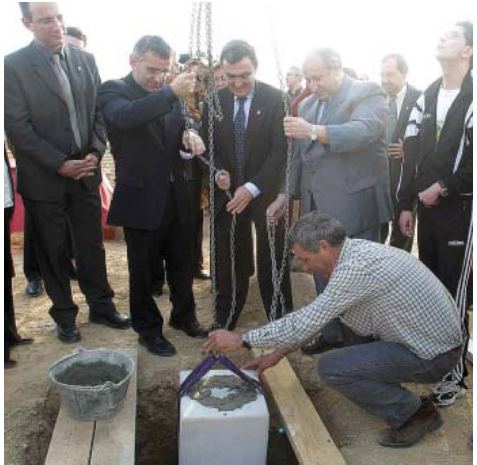
El paer en cap va presidir l'acte simbòlic de col·locació de la primera pedra.

L'Ajuntament de Lleida construeix l'equipament lúdic en una parcel·la de 2.880 m 2 situada a la confluència dels carrers Camí de Marimon i Santa Coloma del barri del Secà de Sant Pere. El recinte disposarà de dues piscines grans de 16,67 x 25 i 16,67 x 8 metres, a més d'una altra de circular per als petits de 6 metres de diàmetre. Les noves piscines estaran adaptades a les persones amb discapacitats.