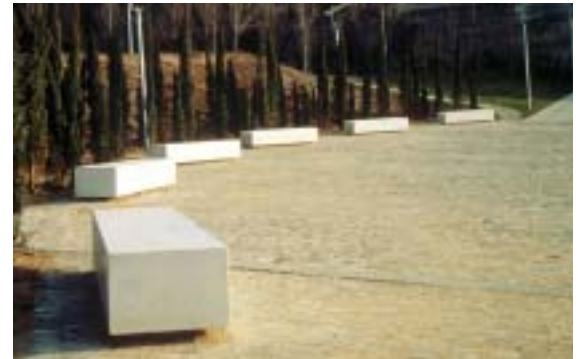
Alguns dels elements de mobiliari urbà (a les fotos, instal·lats en altres ciutats) destinats a l'Eix.

Es recull la proposta de convertir Cardenal Remolins en carrer de vianants, amb l'accés als pàrquings privats regulat, i s'estudiaran les zones i els horaris de càrrega i descàrrega i la situació dels contenidors d'escombraries. La Paeria aplicarà una fórmula nova en les contribucions especials; els afectats pagaran el 43% de les obres, que suposarà la rebaixa del 55% que es pagava habitualment.