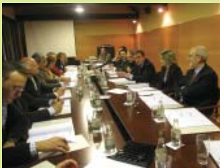
Acte de creació del nou òrgan.

L'alcalde de Lleida, Àngel Ros, va presidir l'acte de creació del nou òrgan i va afirmar que el Consell ha de ser "una plataforma de diàleg, de participació i d'assessorament" entre tots els agents implicats. En aquesta primera trobada es va presentar la proposta inicial de reglament de funcionament del Consell i l'esborrany dels estatuts.