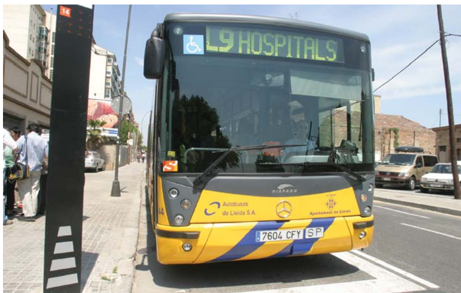
La nova parada a Príncep de Viana, al costat de l'estació, per donar servei als usuaris del tren.

- El carrer de Comtes d'Urgell, entre Príncep de Viana i Anselm Clavé, passa a ser de doble direcció i permet el gir a