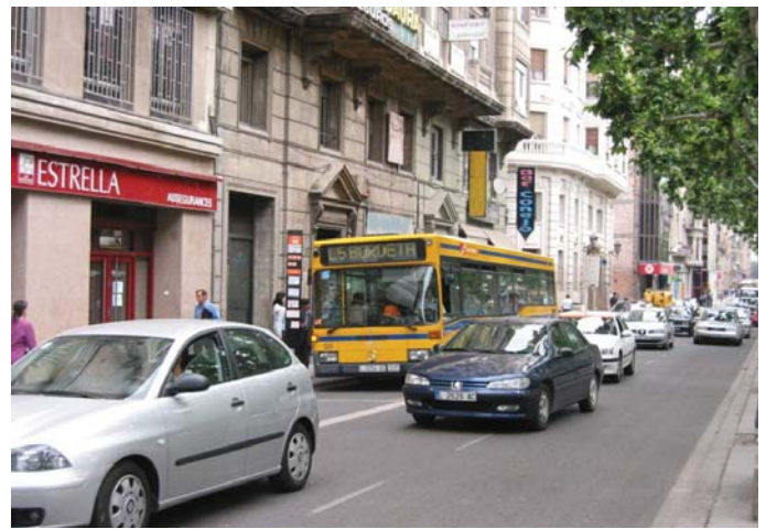
Foto vertical i inferior dreta: dues imatges del carril-bus de Rambla Ferran. Foto superior dreta: el carril-bus de Príncipe de Viana.

l'esquerra per facilitar la incorporació dels vehicles procedents de Pardinyes al carrer Anselm Clavé i l'accés al centre urbà.