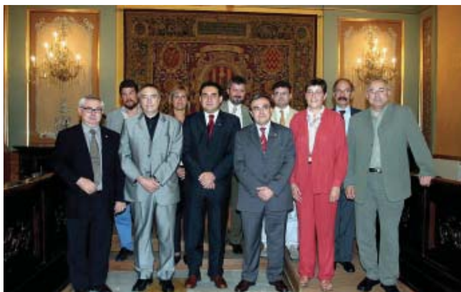
La reunió va aplegar representants de les ciutats catalanes de més de 75.000 habitants.

La normativa introdueix mesures que són aplicables a tots els municipis i altres que ho són només per a les grans ciutats, és a dir, municipis de més de 75.000 habitants que presentin circumstàncies econòmiques, socials, històriques o culturals de caire especial. A Catalunya, poden sol·licitar la seva consideració com a Gran Ciutat els municipis de l'Hospitalet