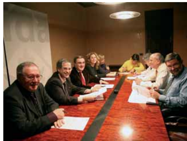
Els consells d'administració del PCiTAL ha adjudicat l'obra a la firma COMSA.

l'Arborètum amb la sol·licitud formal a la Paeria que cedeixi els terrenys de Ciutat Jardí on s'ha de situar el jardí botànic del PCiTAL. També es va aprovar iniciar la licitació del projecte executiu de telecomunicacions del parc, de l'edifici de recerca de l'ETSEA i del de biomedicina.