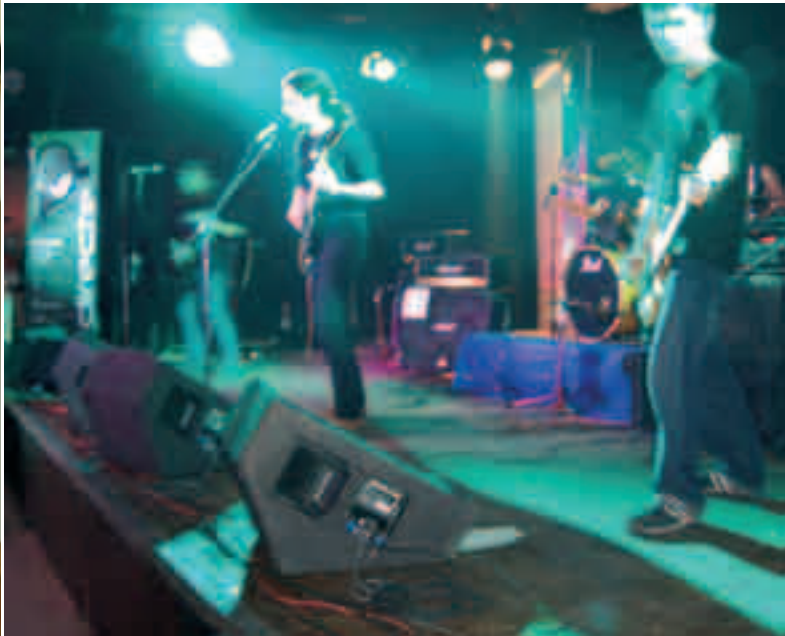
La Mostra de Música Jove permetrà gaudir del treball de 40 formacions.