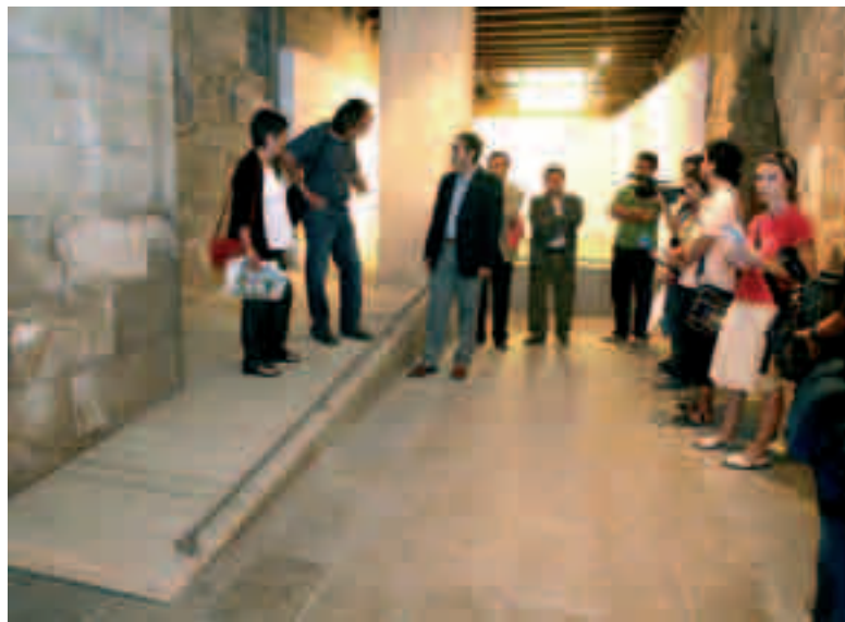
La Paeria ha instal·lat passarel·les al museu.

També en el marc de les actuacions en temes de mobilitat, la Paeria ha iniciat el projecte d'adequació del museu del soterrani de la Paeria perquè pugui ser visitat per persones amb mobilitat reduïda. L'Ajuntament està habilitant una passarel·la que permetrà a les persones discapacitades visitar gairebé tot el mu-