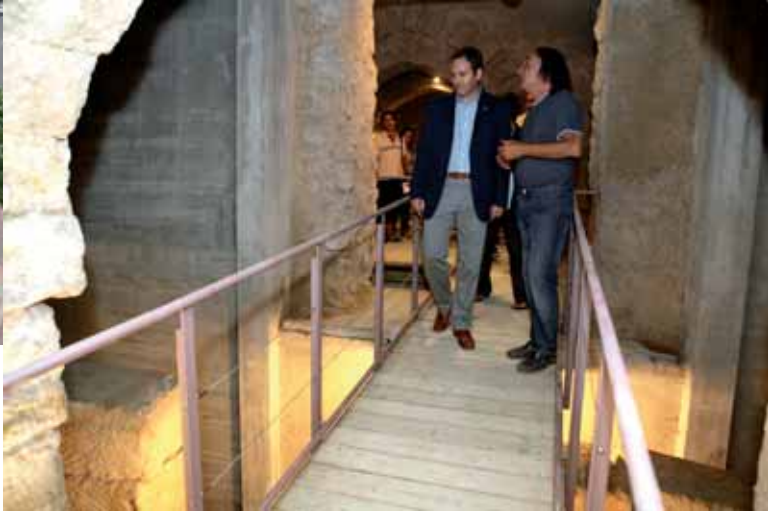
El Museu de la Paeria ha esdevingut recentment un espai accessible.