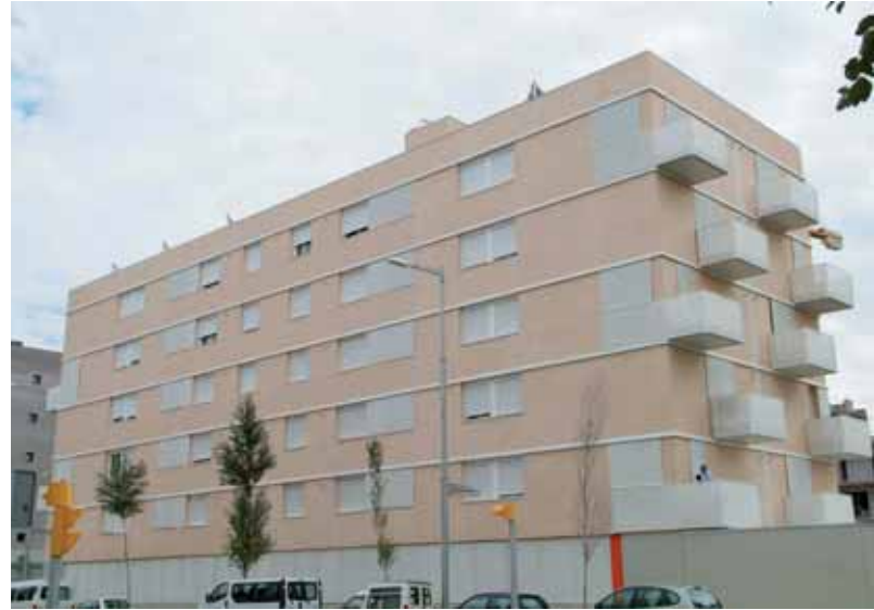
Habitatges de protecció oficial ja construïts a la zona de Balàfia-Pardinyes.

nitiva la nova zona urbana de la Unitat d'Actuació número 28. L'àmbit és de 51.782 metres quadrats i s'hi construiran 600 llars, de les quals 120 seran de protecció oficial i 60 de preu concertat. A més, inclou una zona verda que tindrà 30.438 m 2 . L'operació permetrà iniciar la perllongació de l'avinguda de l'Onze de Setembre a partir de la nova rotonda de l'extrem de l'avinguda de Pius XII. A la cantonada que dona a l'encreuament de Ferran el Catòlic i Pius XII queda un solar de 2.700 m 2 que es destinarà a una nova ludoteca.