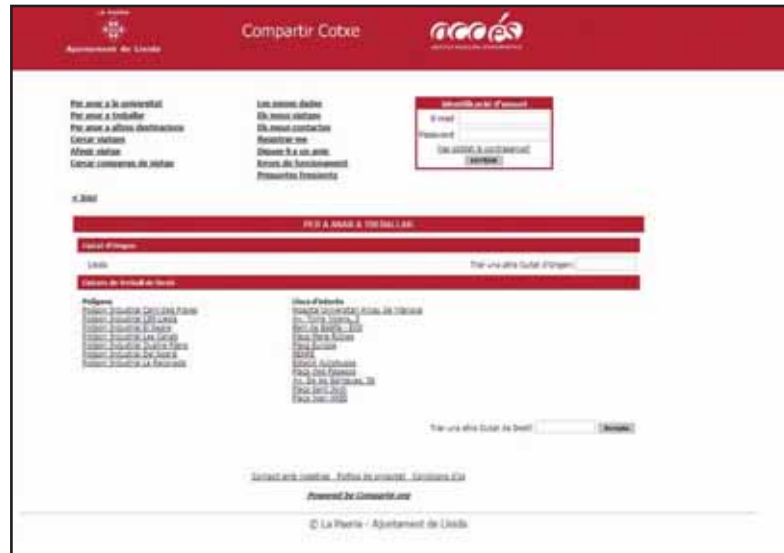
La iniciativa s'adreça a reduir el trànsit i fomentar l'estalvi energètic.

Per utilitzar el servei, pensat especialment per a treballadors i estudiants, cal registrar-se al web ( http://lleida.compartir.org ), introduir-hi les dades del viatge i esperar que algú s'interessi pel mateix recorregut.