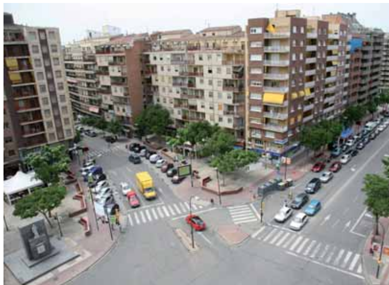
La plaça donarà pas a una de més moderna amb pàrquing subterrani.

L'aparcament subterrani tindrà una superfície aproximada de 3.500 m 2 , disposarà de 3 plantes i oferirà 450 places d'aparcament. El plec de condicions dóna