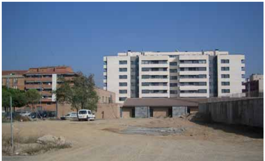
El nou CAP s'edificarà en un terreny situat a l'encreuament entre Onze de Setembre i Valls d'Andorra.

que immediatament traspasarà la finca en ple domini i sense càrregues a la Generalitat de Catalunya, d'acord amb els nous requisits que preveu la normativa catalana.