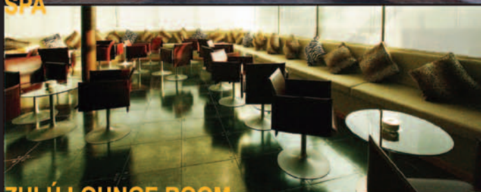
ZULÚ LOUNGE ROOM