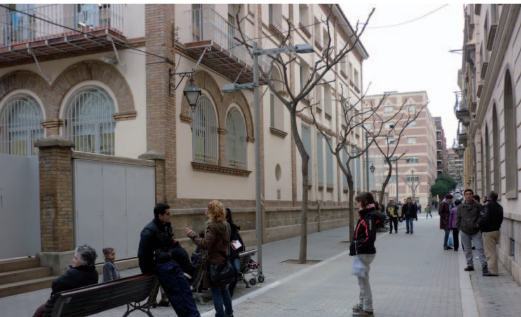
AL CARRER BALLESTER S'HA DONAT PRIORITAT ALS VIANANTS.