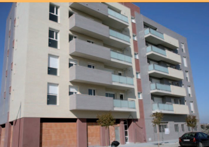
PISOS DE PROTECCIÓ DE SANT PAULÍ DE NOIA.

L'Ajuntament de Lleida ha iniciat les obres de millora del carrer Sant Crist, entre la plaça d'Aurembaix d'Urgell i la rambla d'Aragó. El projecte també preveu la reurbanització de l'espai que hi ha al davant del Museu de Lleida, que donarà pas a una plaça nova.