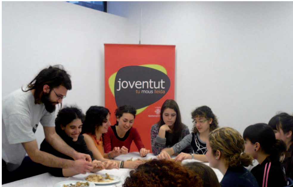
TALLER DE CUINA MARROQUINA, ACTIVITAT DE L'AGENDA JOVE.

Un total de 631 joves s'han inscrit ja en les diferents activitats de lleure organitzades per la Regidoria de Joventut i aplegades sota el programa Agenda Jove febrer-maig 2010. Entre les activitats amb més acceptació destaca una nova línia adreçada a l'aprenentatge de tasques domèstiques, que es desenvoluparà de manera divertida per mitjà d'un taller d'iniciació a la cuina ("cuina per a negats") i un taller de supervivència domèstica que inclou els mòduls de planxa, costura, electricitat i lampisteria.