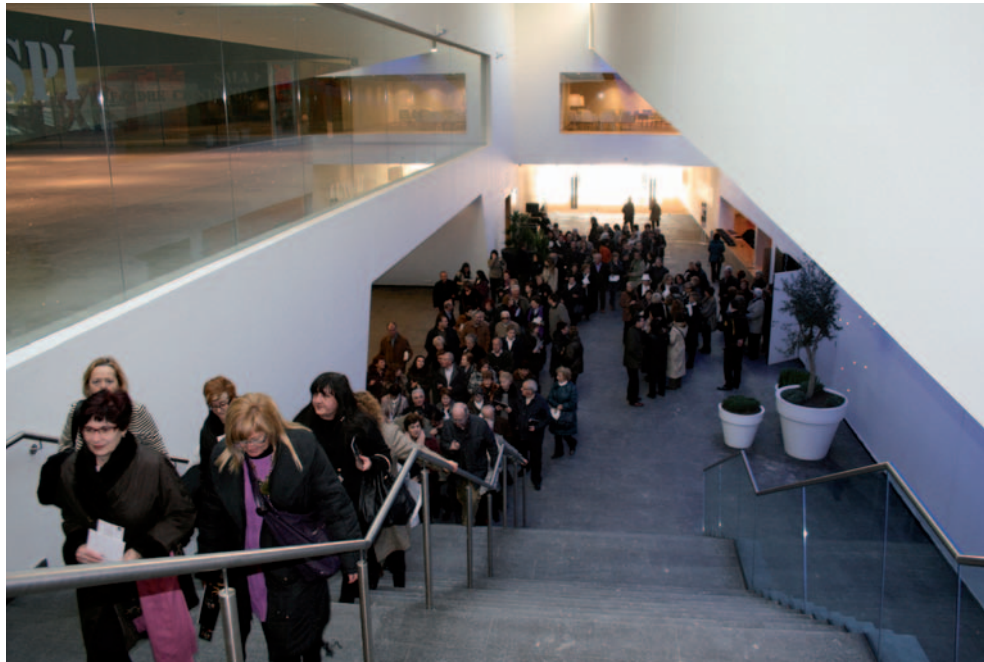
ENTITATS VEÏNALS I GRUPS DE L'ÀREA DE LA DONA HAN VISITAT TAMBÉ L'EDIFICI.

La Llotja de Lleida ja sedueix als lleidatans. Les dues primeres jornades de portes obertes de l'equipament (els dies 22 i 23 de gener) van ser un èxit, amb la participació de gairebé 5.000 visitants. Durant els dos dies es van atansar a les instal·lacions del Palau de Congressos ciutadans i ciutadanes de Lleida i rodalies, majoritàriament públic familiar interessat a conèixer l'equipament nou i la programació prevista per a aquesta temporada.