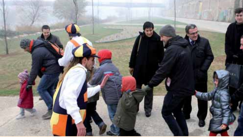
ESTRENA DEL NOU PASSEIG, QUE TÉ ZONES DE GESPA, ARBRES I HEURA.