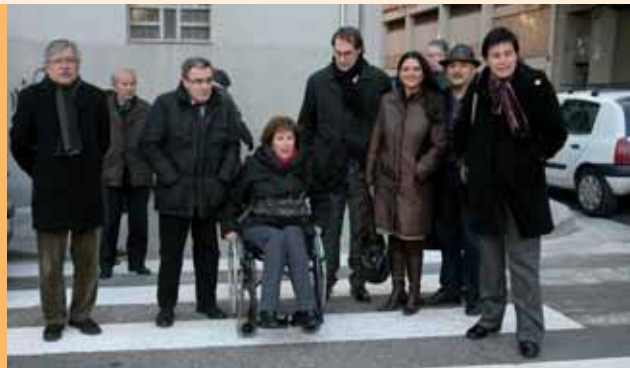
REPRESENTANTS D'ASPID I ASPROS ESTRENEJEN LES OBRES.

Les obres de reurbanització i millora de l'accessibilitat dels carrers Vescomte Arnau, Sant Hilari, Ermengol VI i Tamarit de Llitera, a la Zona Alta, han permès facilitar l'accés als vianants a tot l'entorn de l'hospital Santa Maria. L'actuació ha consistit en l'ampliació de les voreres i la realització de 14 rebaixos. Amb els treballs de millora de la seguretat viària, durant el 2010 s'han adaptat més de 800 passos de vianants a la ciutat.