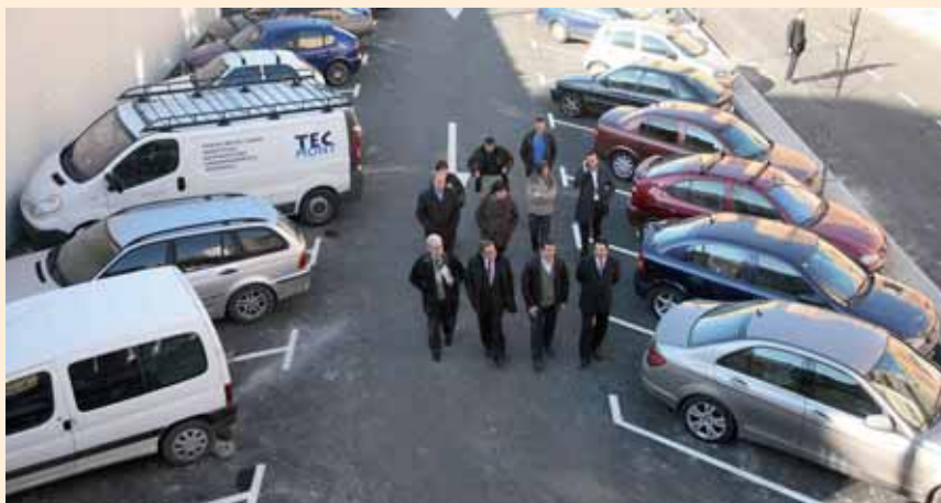
LES OBRES HAN PERMÈS HABILITAR 75 PLACES D'APARCAMENT.

La remodelació del carrer Hospitalers de Sant Joan, al tram entre el carrer Vallès i la part inferior del pont de Corts Catalanes, ha permès definir els espais de circulació, les zones d'aparcament (s'hi han habilitat 75 places) i la construcció de voreres noves, fins ara inexistents. Aquesta actuació de la zona contigua al parc urbà del cobriment de les vies comprèn una superfície de 4.193 m 2 .