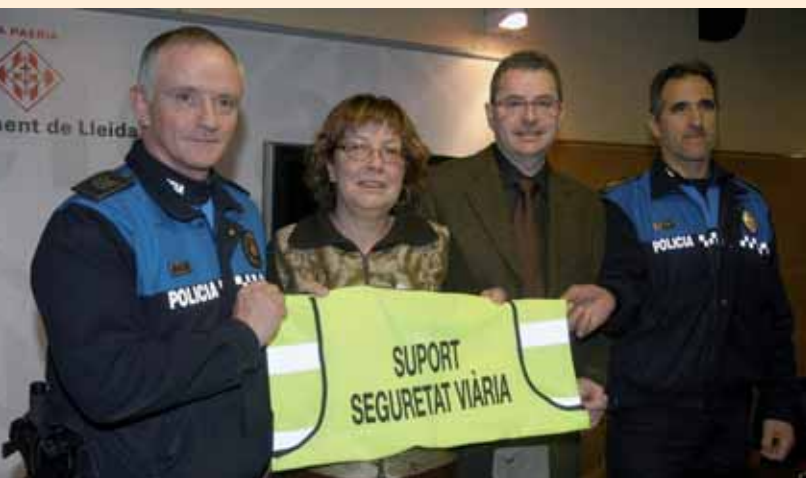
ELS REGIDORS MESTRES I FRANCO PRESENTEN LA CAMPANYA.

GlobaLleida vol contribuir al desenvolupament econòmic, empresarial i territorial de la província amb el foment de l'emprenedoria i l'ocupació, el suport a la innovació i a la competitivitat.