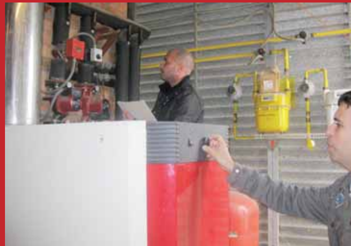
LES ENTITATS REBEN ASSESSORAMENT TÈCNIC.

Les sis primeres entitats a adherir-se a la campanya han estat ASPID, Down Lleida, Associació Shalom, Orfeó Lleidatà, Subdelegació del Govern a Lleida i Subdelegació de Defensa a Lleida.