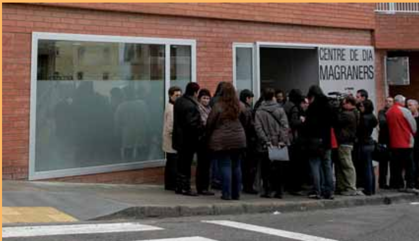
EL CONSULTORI NOU (A DALT) I IMATGE DEL CENTRE DE DIA.

d'Atenció Primària de la Bordeta, com fins ara. Inicialment hi ha una consulta per a medicina de família i per a infermeria, que depèn de l'Àrea Bàsica de Salut Bordeta-Magraners, en la qual, a més de les visites, també s'hi poden dur a terme extraccions de sang.