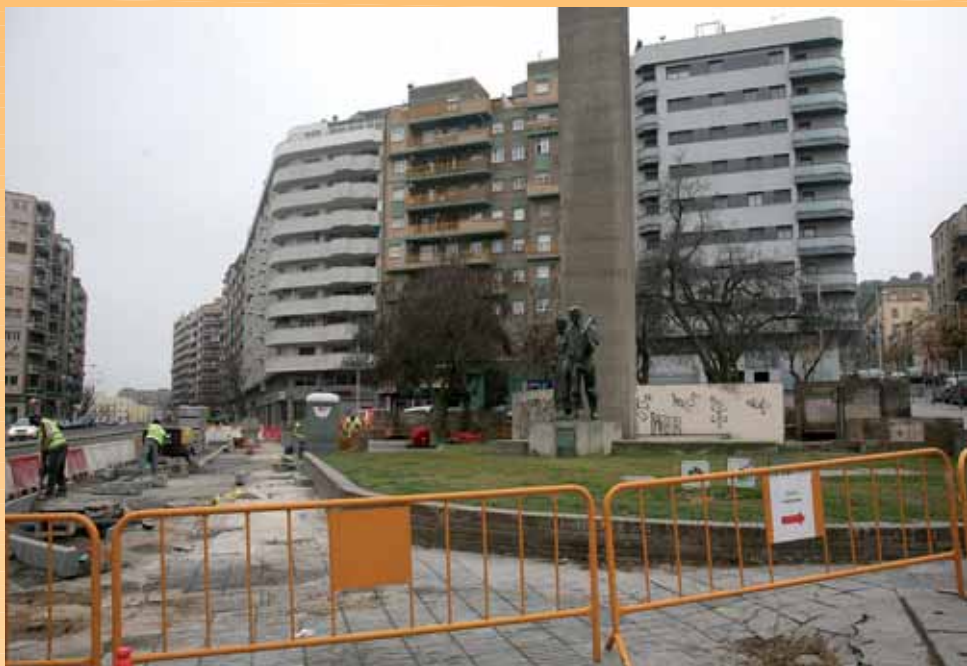
LES OBRES DE RENOVACIÓ INTEGRAL DE LA PLAÇA DELS PAGESOS JA S'HAN INICIAT.

El pressupost d'inversions també inclou una partida de 400.000 euros per al cementiri (més 2 milions destinats a inversió en terrenys) que permetran emprendre la segona fase del departament de Sant Anastasi; 690.000 euros destinats a les instal·lacions de piragüisme o 150.000 euros per a la urbanització del pavelló Secà-Balàfia. Així mateix, en millores de l'enllumenat a la via pública s'invertiran 100.000 euros i 200.000 en el subministrament elèctric a Gardeny.