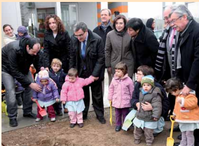
L'ATENCIÓ A LES PERSONES, UN DELS PILARS BÀSICS DEL PRESSUPOST D'ENGUANY.

Seguint els criteris d'austeritat, de reducció de despeses en general i transferències, el pressupost corrent de l'Ajuntament de Lleida, sense incloure inversions per al 2011, serà de 132,2 milions d'euros (augmenta un 2,3% respecte al 2010) i permet generar un estalvi de 2,4 milions d'euros per al finançament de les inversions. Els comptes dels organismes autònoms pugen 28,7 milions; el de les em-