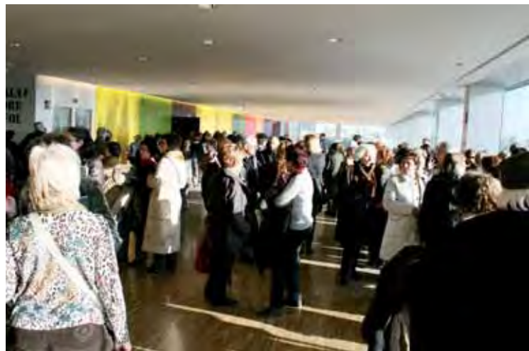
LES JORNADES ES FARAN A LA LLOTJA DE LLEIDA.

Hi assistiran enviats de 250 governos locals i regionals