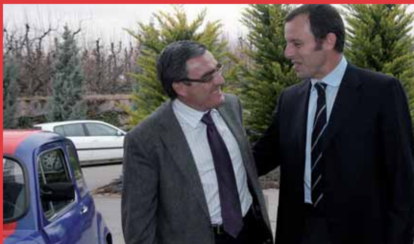
SANDRO ROSELL I EL PAER EN CAP EN UN ACTE A LLEIDA L'ANY 2010.

El president del Futbol Club Barcelona, Sandro Rosell, serà el pregoner de les Festes de Maig de Lleida. Rosell pronunciarà el discurs d'inici de les festes en l'acte oficial que tindrà lloc al Palau de la Paeria el divendres 6 de maig, a partir de les 20.00 h. Sandro Rosell i Feliu és des de l'1 de juliol de 2010 el 39è president del Futbol Club Barcelona. Empresari de màrqueting, és diplomad en ciències empresarials i MBA per Esade. És propietari de l'empresa Bous Sports Marketing, SL. Va ser vice-president del Barça entre els anys 2003 i 2005.