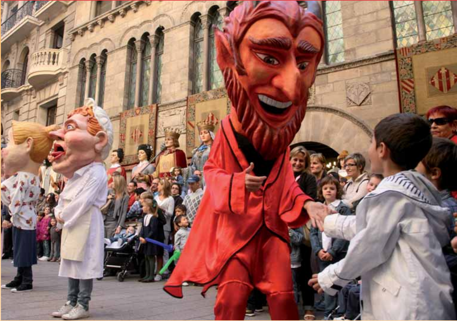
LA CERCAVILA DELS GEGANTS I ELS CAPGROSSOS, UNA CITA CLÀSSICA QUE APLEGA GRANS I PETITS.