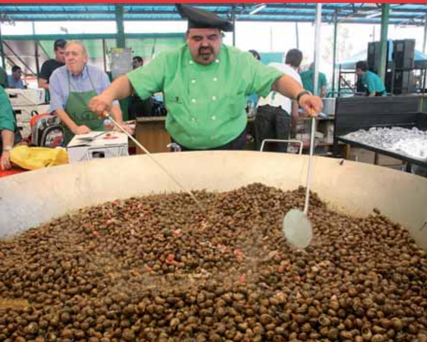
LA GRAN CITA GASTRONÒMICA TANCA UN MAIG CARREGAT DE FESTES.

Els Camps Elisis acolliran del 27 al 29 de maig el XXXII Aplec del Caragol, amb l'objectiu d'arribar als 250.000 visitants. Al voltant de la gastronomia, l'Aplec serà el marc d'un extens programa d'activitats on no hi faltaran els espectacles, la música de les xarangues, les revetlles, les exhibicions de dansa i de castellers, tota mena de divertits concursos, etc. Tot això de caràcter gratuït i obert al públic en general. Entre tots els actes previstos destaca la cercavila colorista i divertida de les penyes que recorre la ciutat diumenge al matí.