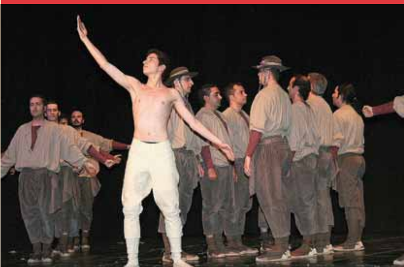
L'ESBART DANSAIRE SÍCORIS REBRÀ LA PLACA DE LA PAERIA.