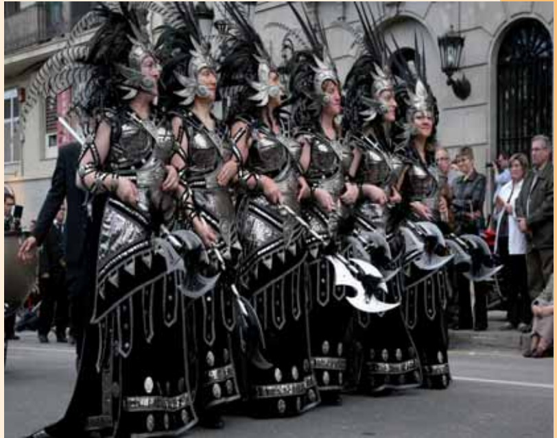
ESPECTACLE, COLOR I EXOTISME A LA GRAN DESFILADA DE GALA.

La festa gran serà el diumenge 15 a partir de migdia amb l'entrada infantil pels carrers del centre històric i el concurs de bandes que finalitzarà a la plaça de Sant Joan. A la tarda, les comparses se citaran a la Porta del Lleó de la Seu Vella per iniciar, a partir de les 18.00 h, l'entrada a la ciutat amb una gran desfilada de gala, que finalitzarà a la rambla de Ferran. A les 21.30 h, les muralles de la plaça de la Sardana de la Seu Vella seran l'escenari dels parlaments del capità cristià, Bernat I (senyor d'Anglesola) i del Caid de Madina Larida Soleyman ibn Hud. Els parlaments donaran pas a la batalla entre moros i cristians que, en aquesta ocasió, portarà la victòria al bàndol de la mitja lluna.