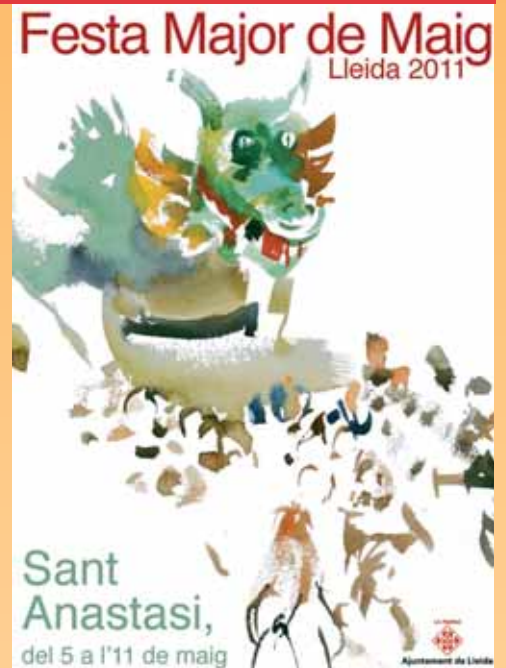
LA BATALLA DE FLORS TINDRÀ LLOC EL DIA DE SANT ANASTASI. A LA DRETA, EL CARTELL DE LA FESTA, OBRA DE JOAQUIM UREÑA © H. SIRVENT/J. UREÑA

gre), el ball folklòric amb la Casa de Extremadura i el Centro Galego (19.00 h, plaça de Ricard Viñes), el XXVII Festival Folklòric Internacional de Lleida (19.00 h, plaça de Sant Joan), el Gran Correfoc des de Governador Montcada fins a la Banqueta (21.00 h) i la Gran Revetlla dels Camps Elisis (23.00 h). Del diumenge 8 cal destacar la XXVIII Trobada i Cercavila de Gegants (11.30 h, plaça de Blas Infante); el 63è Concurs Nacional de Colles Sardanistes (12.00 h, aparcament de l'Auditori); la Diada Castellera, amb la Colla Vella dels Xiquets de Valls, els Xiquets de Reus i els Castellers de Lleida (12.15 h, plaça de la Paeria); el concert de cants gregorians i polifonies derivades (18.30 h, Seu Vella), i la Nit dels Grups de Lleida als Camps Elisis (21.00 h).