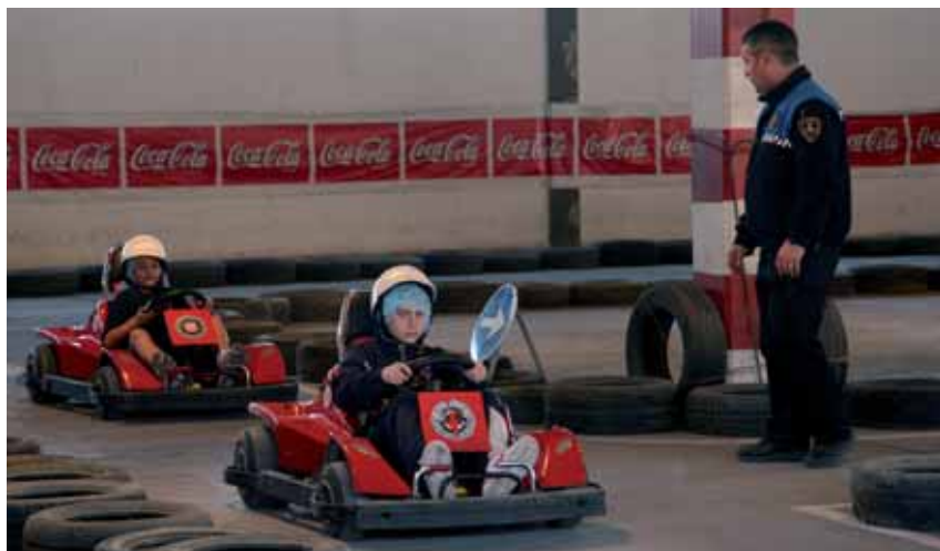
ESCOLARS AL PARC INFANTIL DE TRÀNSIT DE GARDENY.

Les activitats d'educació viària per al curs 2010-11 compten amb la participació de 9.517 alumnes de 44 centres educatius, que aprenen les normes de circulació que han de seguir els conductors i els vianants. Els monitors de la Guàrdia Urbana són els encarregats d'impartir la formació. El Parc Infantil de Trànsit,