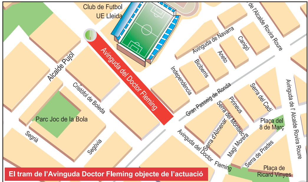
El tram de l'Avinguda Doctor Fleming objecte de l'actuació

En aquest tram de Doctor Fleming s'ampliarà fins a 5,5 metres la vorera més propera als blocs d'habitatges i comerços, i també es preveu la plantació d'una trentena d'arbres nous, la renovació de tot l'enllumenat i la