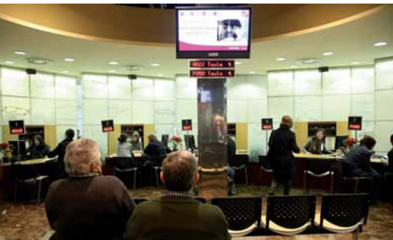
L'OMAC VA ATENDRE EL 2010 UNA MITJANA DE 6.872 PERSONES AL MES.

ments que dediquen una especial atenció a la gent gran, estan adreçats a tota la població, des dels més petits fins a persones amb mobilitat reduïda. L'espai lúdic i de salut més nou és situat al davant del centre cívic del Secà. Es tracta d'un circuit d'exercicis dissenyat per treballar les principals parts del cos amb l'objectiu de promoure l'activitat física i els hàbits saludables entre la gent gran.