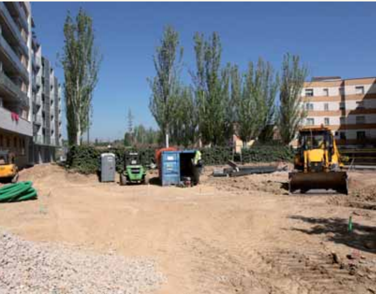
LA ZONA TINDRÀ 4.350 M 2 DE SUPERFÍCIE.