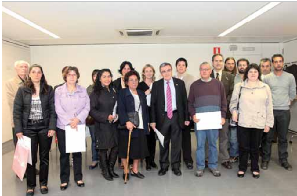
ELS NOUS VEÏNS I VEÏNES DE L'EDIFICI, AMB L'ALCALDE ÀNGEL ROS.

La Paeria ha lliurat les claus de 19 habitatges en règim de lloguer social situats al carrer Cavallers, 14-20, al Centre Històric. Els pisos –8 dels quals són dúplex– tenen entre 45 i 70 m 2 i disposen d'1, 2 o 3 habitacions. Tots tenen menjador, cuina i, depenent de la superfície, 1 o 2 banys. A més, l'edifici compleix amb la normativa