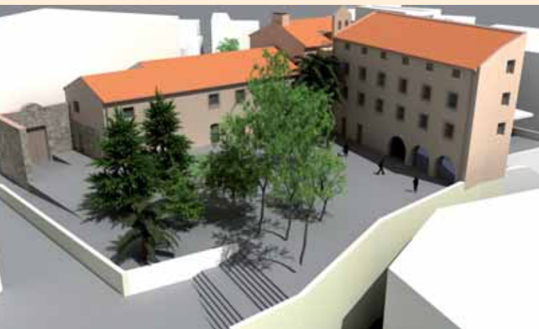
IMATGE VIRTUAL DE LA REHABILITACIÓ DE L'ALA EST DEL CONVENT.

zena de places d'aparcament. En el tram final del carrer Vila Antònia, a l'encreuament del carrer del Riu i el passatge Miquel Fargas fins a l'avinguda del Segre, es crearà un espai públic nou, que incorporarà mobiliari urbà, quatre arbres nous i jardineres.