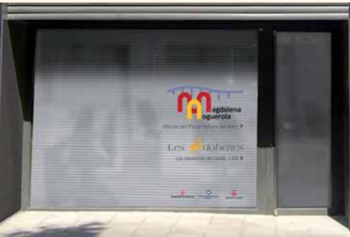
ELS AJUTS ES PODEN DEMANAR A L'OFICINA DEL PLA DE BARRIS.

utilitzat xapa corten i té unes obertures aleatòries a tota la seva superfície per poder veure reflectides les pedres de riu pintades en vermell a l'interior que representen el fruit de la magrana. L'escultura s'ha col·locat inclinada a 60° respecte de l'eix central per donar una sensació de moviment. Fa poc més d'un any, la Paeria va urbanitzar la zona compresa entre els carrers Vila-rodona, Camp i la costa de Magraners.