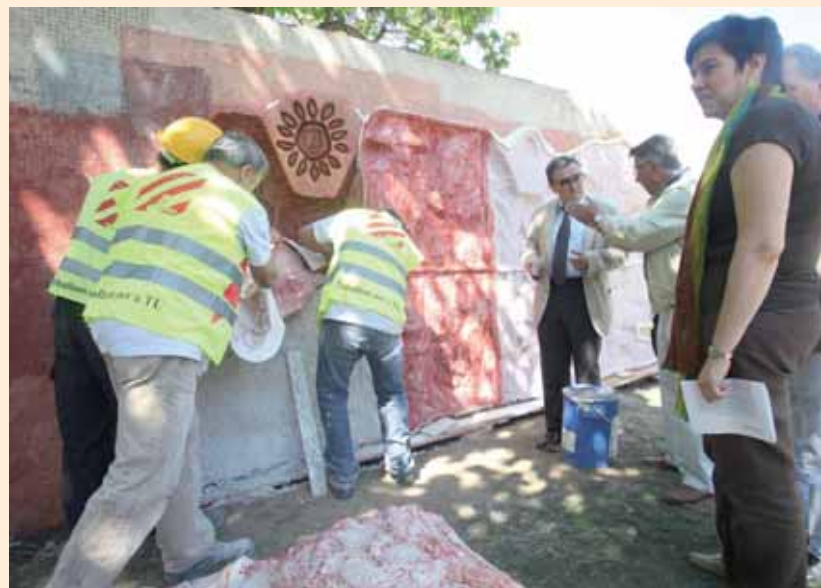
ES PRESERVARÀ EL MURAL ESCULTÒRIC QUE HI HAVIA.

La millora de l'accessibilitat interior de la plaça i des dels carrers que l'envolten es farà amb l'enderroc dels murs perimetrals, l'eliminació de les barreres arquitectòniques, la reconstrucció de les escales i la construcció d'una rampa accessible des del carrer Saturn. Cal destacar, a més, la instal·lació de punts de llum –fins ara inexistents a la plaça–, que estaran