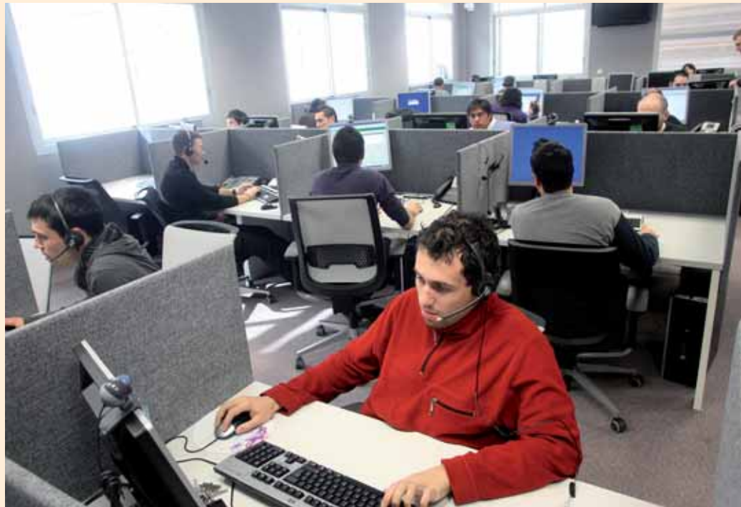
TREBALLADORS D'INDRA, UNA DE LES 62 EMPRESES QUE HI HA ACTUALMENT AL PARC.

Pel que fa al desenvolupament del Pla Especial de Gardeny, es troba en procés de redacció i serà sempre propietat pública. S'hi podran fer equipaments de caire científic, recerca i desenvolupament, espais empresarials i tot allò