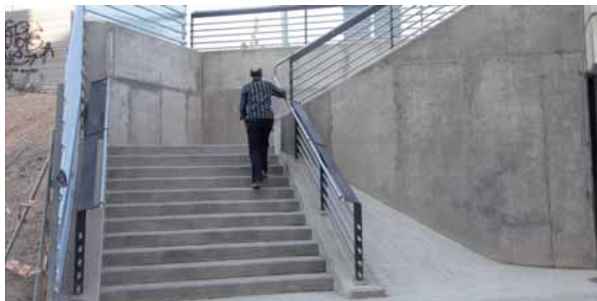
L'ESCALA SITUADA AL CARRER LLUÍS ROCA.

cessibilitat a ambdós vials. Paral·lelament, l'Administrador d'Infraestructures Ferroviàries ha finalitzat l'actuació a la plaça de l'Estació, amb la qual cosa s'ha acabat la urbanització de la zona per guanyar espai per als vianants. A més, també s'ha instal·lat una marquesina de 12 metres de longitud a la parada de taxis, amb una estructura metàl·lica i tancaments de vidres.