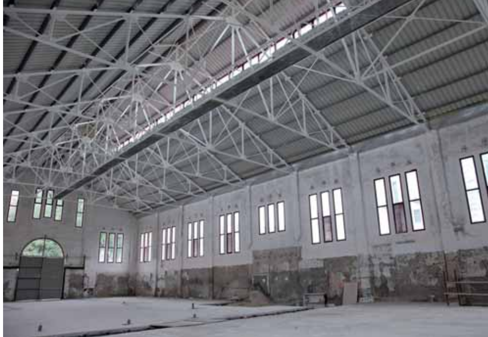
EL MERCAT TINDRÀ DEU PARADES DE PRODUCTES AUTÒCTONS.

La Paeria ha adjudicat a l'empresa Damarim, SL la segona fase del Mercat del Pla amb un import de 368.043,94 €. L'actuació consisteix bàsicament en l'adequació de l'interior de l'equipament amb 10 parades de venda de productes agroalimentaris lleidatans amb