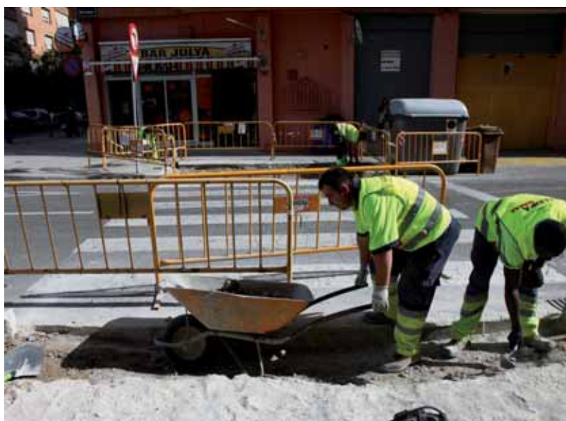
OBRES DE MILLORA AL CAMÍ DE CORBINS AMB SANT JERONI.

A més, dins dels projectes del Fons Estatal per a l'Ocupació i la Sostenibilitat Local, es va abordar un projecte global per construir o millorar un total de 750 guals o rebaixos de voreres a tots els barris de la ciutat.