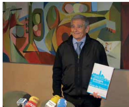
El Síndic de Greuges, Josep Giné.

El Fòrum SD és una associació sense ànim de lucre formada pels Síndics, Síndiques, Defensors i Defensores dels Ajuntaments. Els seus objectius