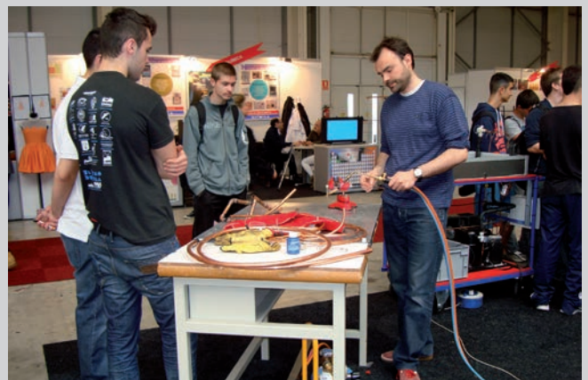
La Paeria continuarà potenciant els ensenyaments de FP.

“El municipi vetllarà per l’impuls educatiu a tots nivells, des del manteniment de la xarxa de les escoles bressol fins al reforç del binomi ciutat-universitat defen-