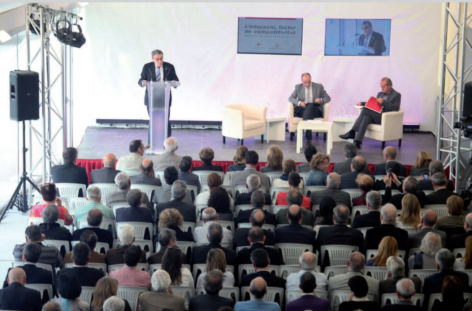
La 15a edició de la conferència anual de l'alcalde va congregar una variada representació de la societat lleidatana.