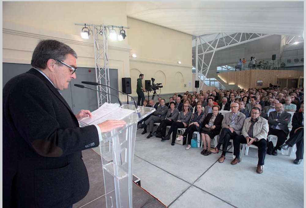
Un gran nombre de persones van assistir a la conferència, que es va fer al Magical Media.

tiu i laboral”, va remarcar l’alcalde. L’Ajuntament de Lleida augmentarà l’oferta d’educació complementària als centres i famílies de Lleida i s’ampliaran els ensenyaments artístics. L’alcalde va anunciar que Lleida tindrà la titulació oficial de Formació Superior en Arts Escèniques