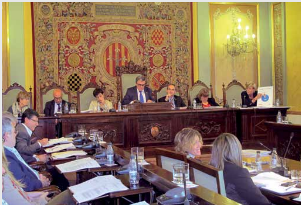
Les Ordenances Fiscals per a l'any 2014 es van aprovar al Ple de la Paeria del 25 d'octubre.

Les Ordenances Fiscals de l'any 2014, aprovades pel Ple de l'Ajuntament de Lleida el 25 d'octubre, preveuen la congelació o rebaixa de tots els impostos i taxes municipals i incrementa significativament les bonificacions per raons socials en impostos com l'IBI i plusvàlua, i també en les taxes educatives i socials.