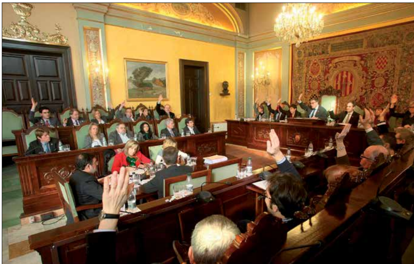
Un total de 21 regidors del PSC i CiU van votar favorablement els pressupostos municipals del 2014.

• Els comptes municipals de la ciutat per a l'any 2014 pugen a 158,7 milions d'euros