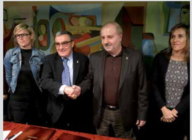
L'alcalde i el cap de l'oposició formalitzant l'acord del pressupost.

la previsió d'economies en l'execució del pressupost (estalvi, liquidació de pressupost i fons de contingència) als àmbits d'Urbanisme, Promoció Econòmica, Comercial i Turística, Social i Tercer Sector i Educació i Cultura, com també al foment de polítiques d'ocupació, que permetrà destinar 500.000 euros més a l'activació del treball. L'acord estableix també que es constituirà una comissió