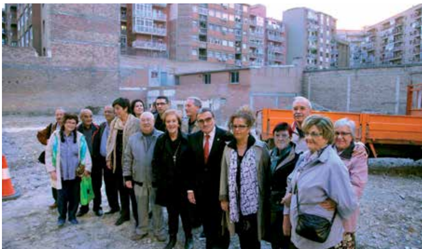
L'actuació preveu habilitar un aparcament amb 55 places gratuïtes.

• Permetran la renovació i l'ampliació de les voreres per donar més prioritat als vianants