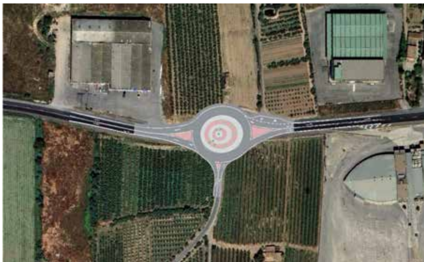
Recreació de la rotonda que es construirà a la cruïlla d'accés a Butsènit.