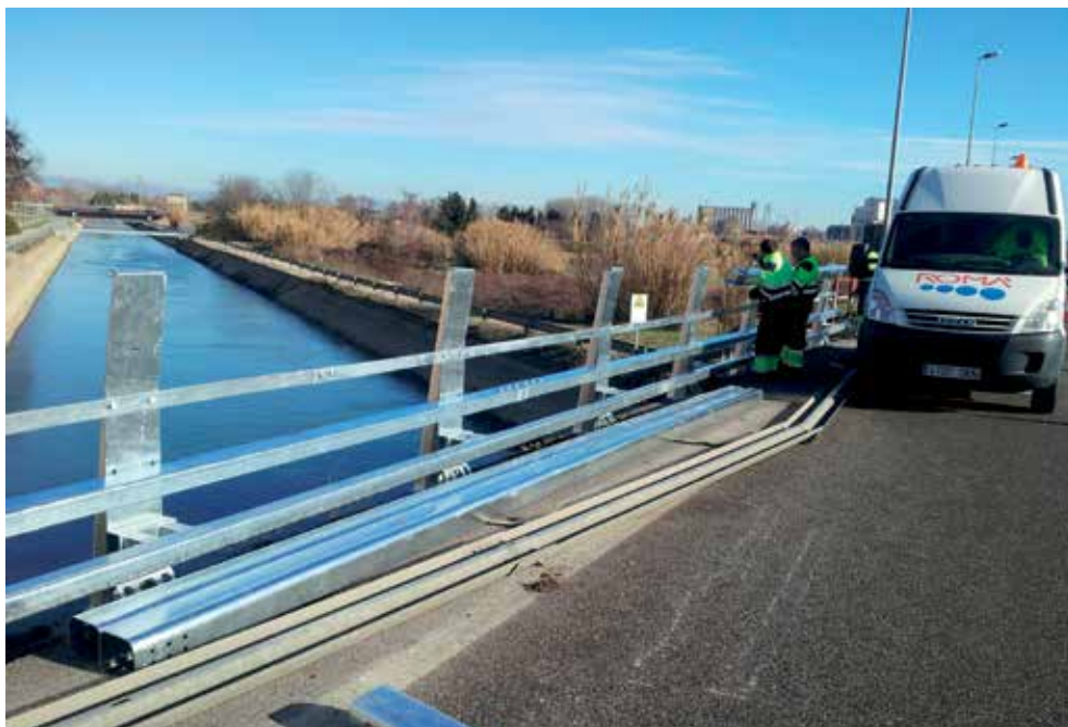
Treballs per garantir la seguretat de l'LL-11 sobre el canal de Seròs.

Les actuacions a la via pública, que seran 138 en total, consisteixen en la posada en marxa de la proposta 6 del Pla de Mobilitat Urbana amb relació a la protecció de 110 passos de vianants (millora d'ubicació, visibilitat, il·luminació, eliminació