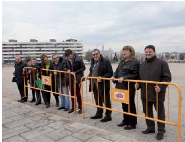
El pàrquing es va inaugurar durant les festes nadalenques.

Lleida va guanyar durant el 2013 prop de 1.000 noves places d'aparcament gratuït i dissuasiu, la qual cosa suposa un increment