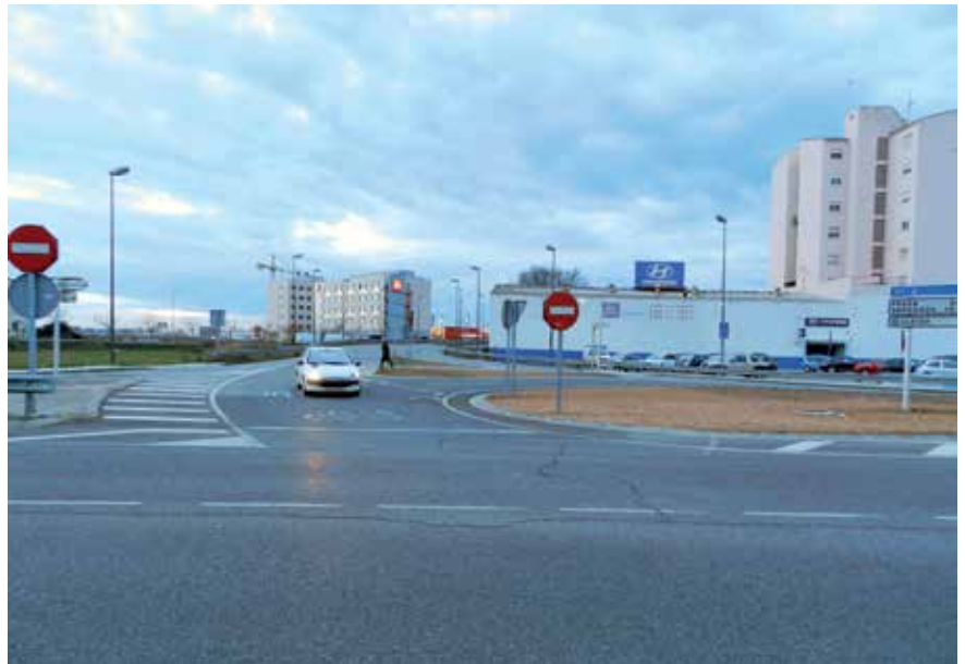
S'actuarà a l'avinguda de les Garrigues, en la zona de connexió amb la LL-11 i la Bordeta.

A la Mariola s'hi actuarà a la zona que limita amb la rotonda de Pius XII a l'altura de Ferran el Catòlic i Onze de Se-