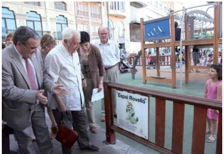
L'espai infantil Rovelló, situat entre Blondel i Cavallers, un dels indrets que s'ampliaran.