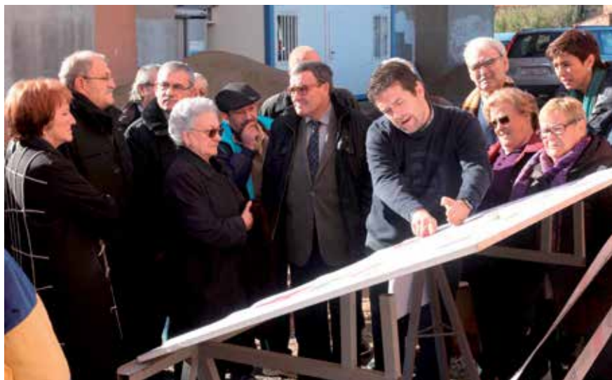
L'espai públic serà objecte d'una remodelació integral.

La plaça de Balàfia viurà una transformació integral que permetrà millorar l'accessibilitat, adequar zones de jocs infantils, paviment nou, enllumenat, jardineria, mobiliari urbà nou, com també una zona de petanca.