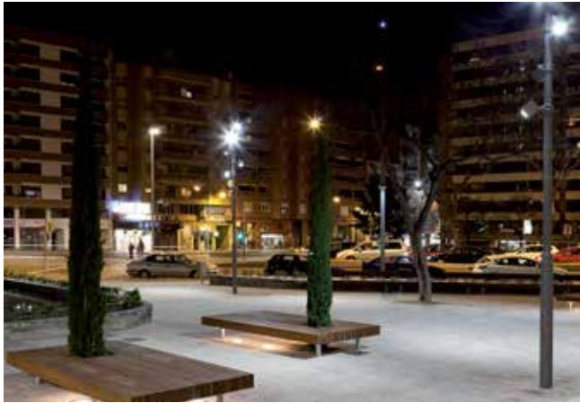
Lenllumenat de la plaça dels Pagesos, instal·lat fa dos anys.

• Servirà per pagar el manteniment de la xarxa d'enllumenat i amortitzar la inversió