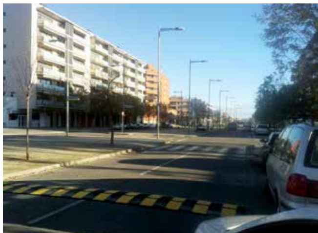
Millora de la seguretat viària al carrer Corregidor Escofet.

ments en llocs que dificultin la visibilitat dels conductors i els vianants, la realització de girs prohibits, la presència estàtica en les vies de més intensitat de trànsit en hores punta i els controls