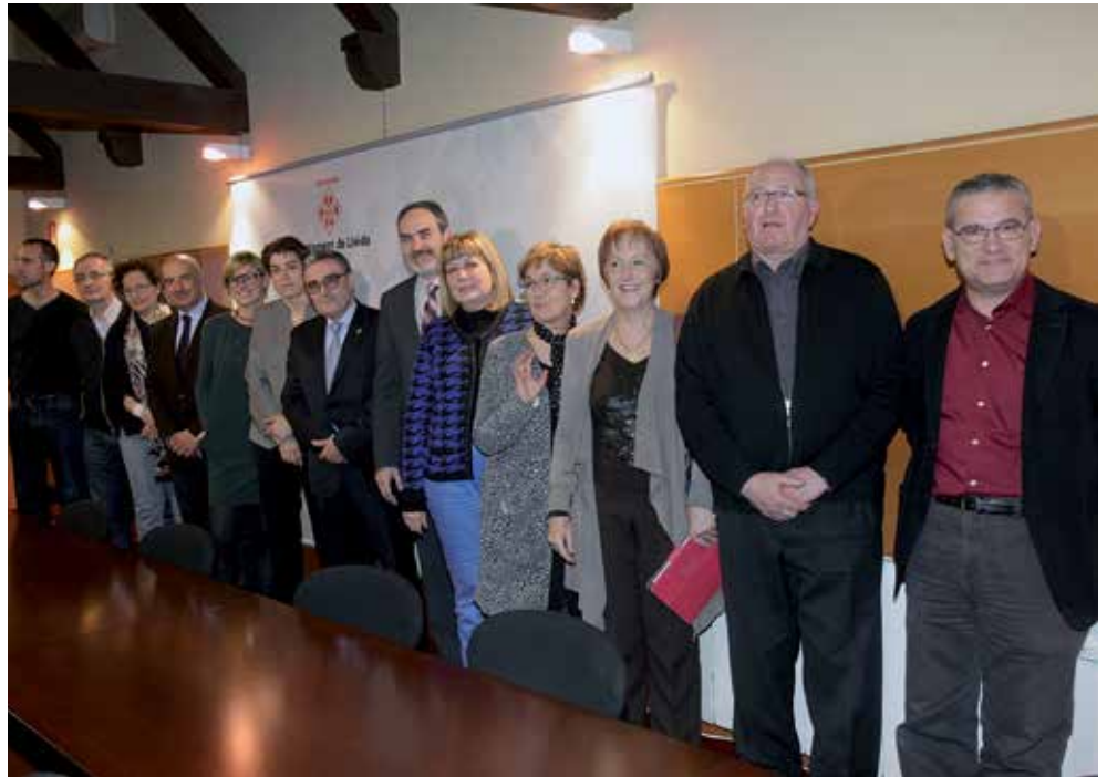
Imatge dels components de l'equip de govern municipal.