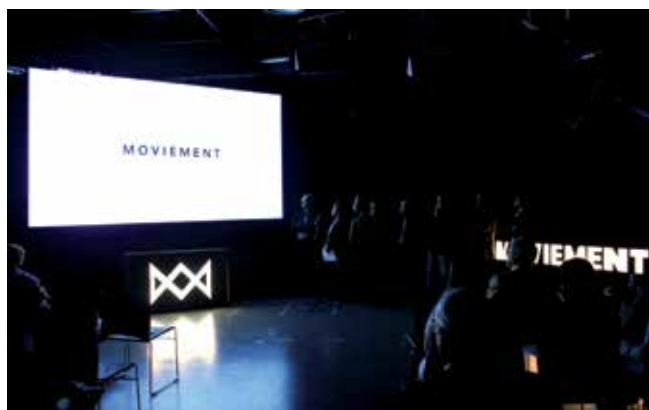
Presentació del projecte al Magical Media.

• El Magical Media acollirà l'abril del 2015 les primeres jornades "Moviment"