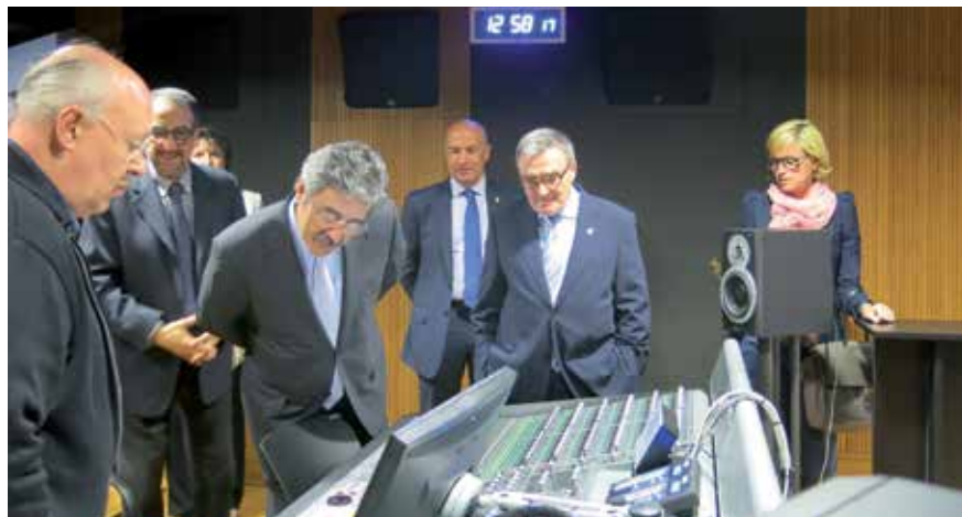
El director de Telefónica a Catalunya, l'alcalde i regidors visiten el Magical Media.

• Lleida, ciutat capdavantera en telecomunicacions de la mà de Telefónica i Jazztel