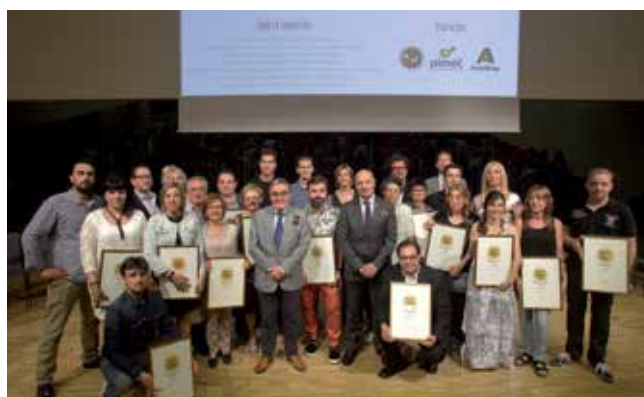
La gala final dels guardons es va celebrar a La Llotja.

A banda de la creació del guardó al Comerç Excel·lent de l'Any, com a novetats, també s'han guardonat establiments històrics lleidatans, amb un mínim de 50 anys d'obertura, i s'han lliurat mencions especials a les candidatures no premiades però que presenten alguna singularitat destacada. Els comerços històrics guardonats han estat Forn Nou,