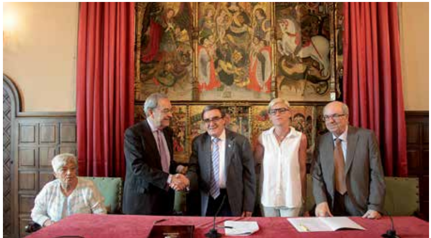
Signatura del conveni de col·laboració entre la Paeria i l'Obra Social "La Caixa"

El compromís suposa un pas més en la col·laboració que ambdues institucions mantenen des del 1998 i que ha permès dur a terme un ampli programa d'activitats a 10 llars de gent gran conveniades i als dos espais propis de l'Obra Social "la Caixa". Durant el darrer any gairebé 12.000 persones de Lleida van participar en les 384 activitats programades, destinades a fomentar un envelliment actiu.