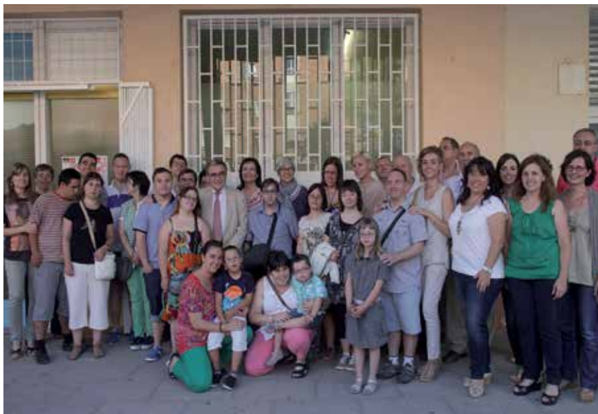
L'alcalde de Lleida amb membres i familiars de l'Associació Síndrome de Down.

• La Paeria renova també la cessió de les dependències per a la Llar de Persones Sordes